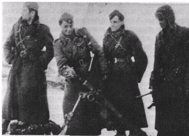
Dejstvo minobacačkog odeljenja š sremskom frontu

Nijemci su koristili vatru sopstvene artiljerije da mirnije pojačaju streljački stroj, da dobiju podršku više tenkova i silovito krenu. Trkom su pošli da osvoje položaje Desete krajiške i zauzmu Mirijevo. Dočekani su vatrenim uraganom i nisu uspjeli. Nadu su polagali u tenkovski udarni klin i opet krenuli. Protivtenkovski topovi crvenoarmijaca su pomogli Krajišnicima u zadržavanju tenkova da ne pregaze njihove položaje. Tri prednja tenka direktno su pogođeni i pretvoreni u vatrene buktinje. Ostali su manevrisali i tražili zaklone da izbjegnu protivtenkovske granate. Zadržan je i