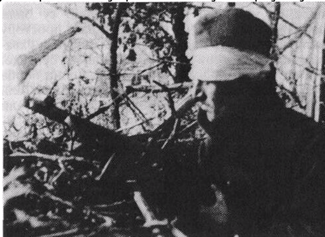
I ranjeni borac, automatičar, nije napuštao borbeni položaj

Poučeni gorkim iskustvom, četnici su se umješnije pripremili da odbiju nalete jedinica Desete krajiške. Iz Ivanjice u pomoć im je pohitao bataljon neprijateljskih vojnika i borba