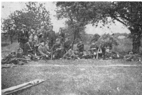
3. vod 3. čete 3. bataljona u Trokutu, poslije povlačenja iz Slavonije, maj 1944.

U zidnim novinama, koje su tih dana izlazile, pisalo se o stanju na drugim frontovima i novoj ofanzivi Crvene armije. Ipak, najviše se pisalo o otvaranju drugog fronta na obalama Francuske Normandije. Tog dana, 6. juna, sa britanskih ostrva, öko 5.000 ratnih i desantnih brodova i preko 13.000 borbenih i transportnih aviona, (ukupno 36 divizija) otpočeli su sa prebacivanjem preko Lamanša. Time je počelo rušenje Hitlerovog »Atlantskog bedema«. Vojnici zapadnih saveznika su već prvog dana uspostavili dva mostobrana, čime je obezbeđen dalji dolazak trupa sa Britanskih ostrva. Na taj način je stvoren drugi front, koji je tih dana bio predmet dugih diskusija.