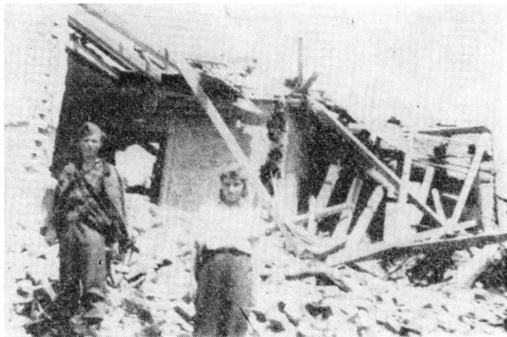
Kraj bombardovanjem porušenog župnog dvora u selu Dubravec februara 1944.

kovčak — s. Haviđić — s. Lipnica i s. G. Trputci. Istog dana, u popodnevnim časovima, neprijateljska avijacija je bombardirala s. Dubranec i srušila nekoliko kuća. Tom prilikom poginula su 2 borca, a 2 su ranjena. Od 28. februara do 2. marta jedinice brigade nalaze se u istim rejonima. Noću, 2/3. marta, po naređenju štaba divizije, a u vezi sa pripremama napada na s. Zdenčinu, brigada upućuje svoj 3. bataljon da na sektoru Horvati — Zdenčina obezbijedi prelaz preko pruge 16. omladinskoj brigadi »Joža Vlahović«. 17 Dok su sve jedinice bataljona bile na