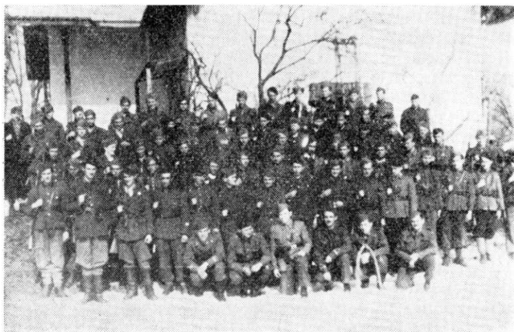
Škola za vojne rukovodioce 34. divizije

Prorađivane su i objašnjavane odluke II zasjedanja AVNOJ-a, a u drugom periodu februara posvećena je veća pažnja raskrinkavanju politike Mačeka i suzbijanju pojava defetizma i dezerterstva. U vezi s tim su prorađivani članci