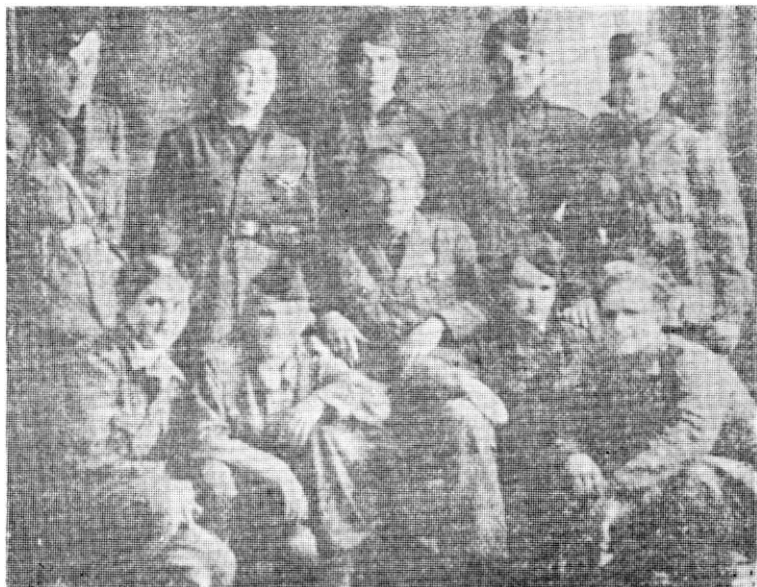
Sanitetsko osoblje 6. vojvodanske brigade

sanitet je registrovao 141 ranjenog i 95 poginulih. Za vreme borbi na Virovitičkom mostobranu od 16. januara do 9. februara 1945. godine brigadni sanitet je prihvatio i obradio 372 ranjena i 97 poginulih. U završnim operacijama za konačno oslobođenje zemlje brigada je imala 628 ranjenih i 154 poginula. 23