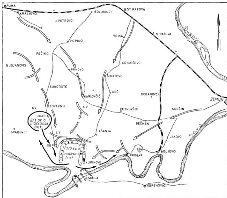
Neprijateljska ofanziva »Majkafer und mira«, maj 1944. godine

Po dobijenim obaveštenjima o grupisanju neprijatelja štab 2. bataljona 1. sremskog odreda, kod koga se nalazio i komandant odreda, doneo je odluku da se deo snaga ostavi u podzemnim bazama u selima Tovarnik, Progar i Obrež, a ostale snage da se raspodele u Kupinskim livadama i Vitojevačkim gredama. Plan štaba bataljona je sproveden u toku noći 6/7. maja. Već 7. maja neprijatelj je počeo ofanzivu paleći kuće u Obreži i Kupinovu. U toku dana do 20 časova neprijatelj je izbio na liniju: zapadno od Kupinova drum Kupinovo — Obrež, jugozapadna ivica šume Lošinci, selo Grabovci i reka Sava. Izbijanjem neprijatelja na pomenutu liniju obruč je bio potpuno zatvoren. 8. i 9. maja neprijatelj je jakim snagama krstario terenom. Pročišćavanje je nastavljeno i sledećih dana uz manje sukobe sa partizanima. Ali se obruč oko naših snaga sve više ste-