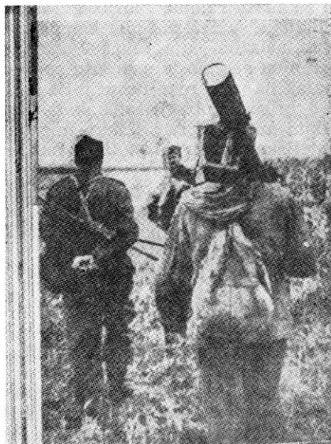
Minobacačko odeljenje 6. vojvodanske brigade u pokretu ka položaju

Ubrzo je, 16. maja po razbijanju blokade Obedske bare, bataljon 1. sremskog odreda ušao u sastav 6. vojvodanske brigade i postao njen 3. bataljon. Time je ujedno bila završena reorganizacija brigade, ali i jedna akcija protiv neprijatelja koja je imala širi značaj po specifičnostima koje su brigada i odred primenili u načinu vođenja borbe