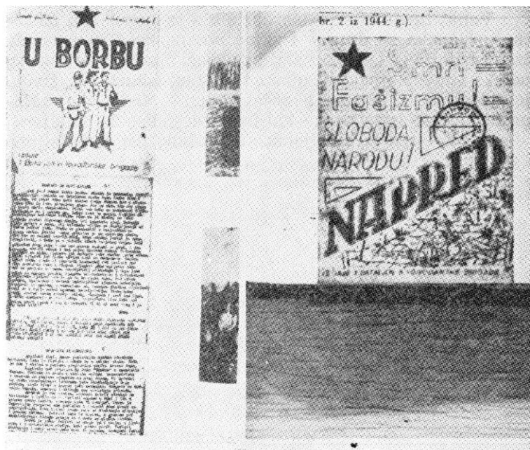
Foto-kopija naslovnih strana bataljonskih listova koje su izdavali kulturno-prosvetni odbori u leto 1944. godine

Uspela proslava 1. maja bila je povod da se organizuje i šira proslava omladine i partizana nazvana »ĐURĐEV-DANSKI URANAK«, koju bi pripremio i realizovao 3. bataljon zajedno sa Sreskim komitetom [3KOJ-a Rume i Zemuna. Po sadržini programa i masovnosti pripremana je proslava od šireg političkog i kulturnog značaja za jugoistočni Srem. Međutim, proslava nije održana po planu pošto je već za vreme prikupljanja omladine neprijatelj počeo da izvodi blokadu tog rejona u nameri da spreči proslavu i razbije naše snage. Posle danonoćnih borbi 3. bataljon je uspeo da razbije neprijateljsku blokadu i veći deo nenaoružanog naroda izvuče iz obruča.