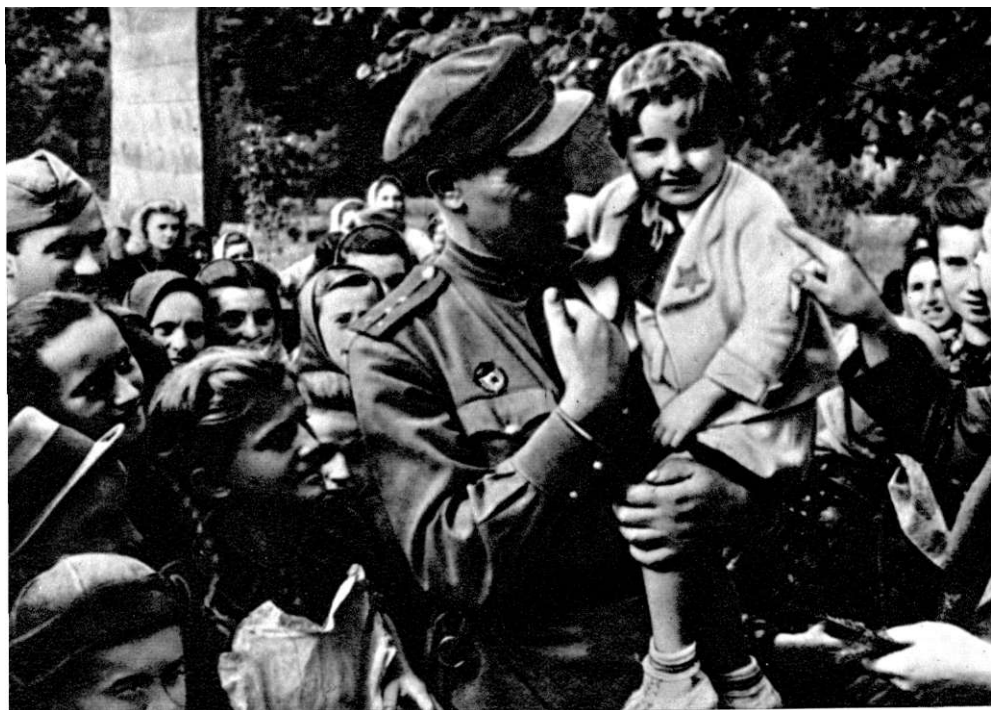
Sovjetski oficir među stanovnicima oslobođenog jugoslavenskog sela