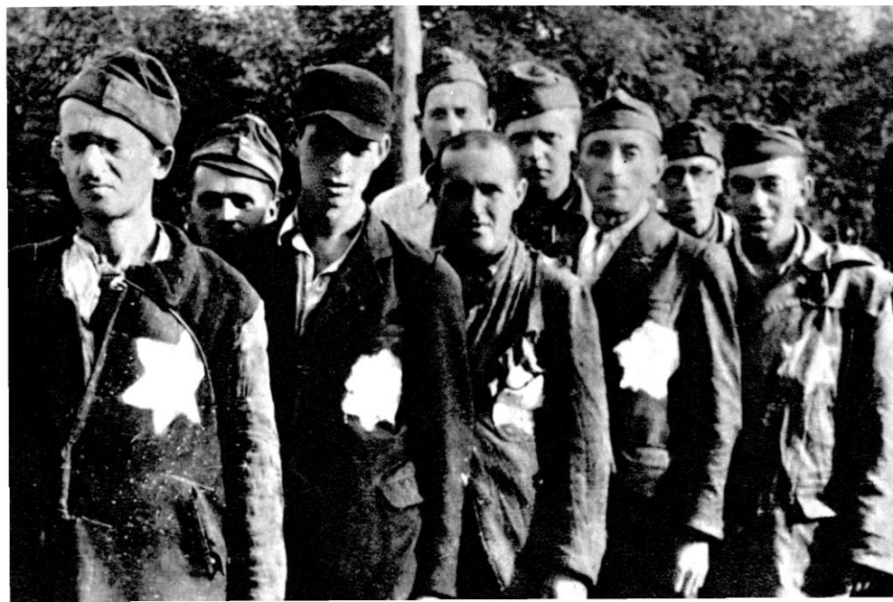
Grupa oslobođenih zatvorenika iz koncentracionog logora u rejonu Bora