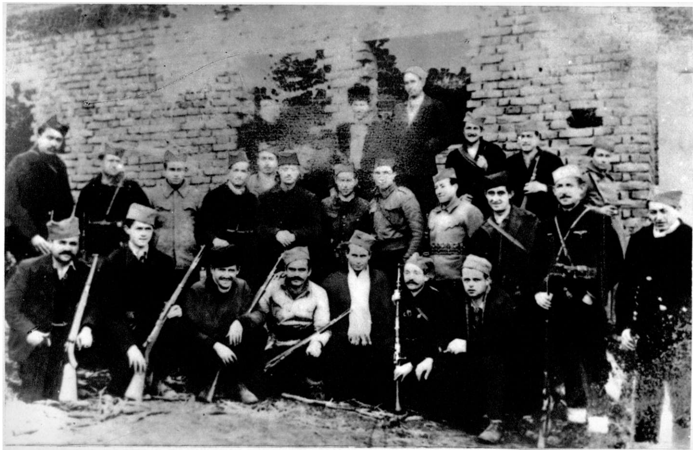
Политички лартијски курс у Славнику, Пуста Река, децембра 1943. год.