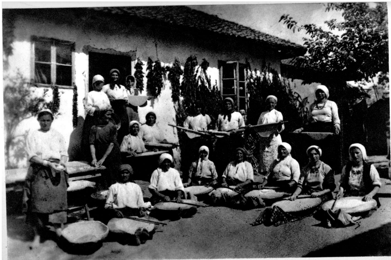
АФЖ у Пустој Реци, 1943. РОД припрема храну за рањенике