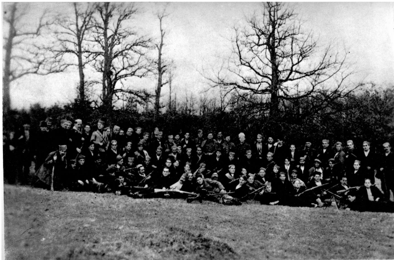
5. батаљон, I ЈМПО, 1943. год. у Гајтану