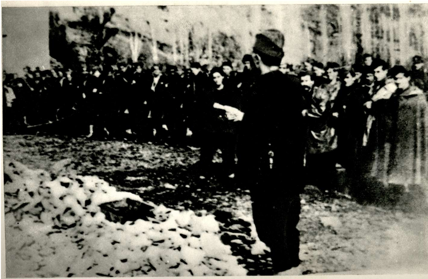
Формирање VI јужноморавске (касније VIII српске) бригаде, 8. марта 1944. год. у Трговишту