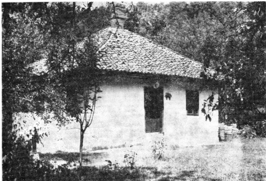
Марнова Црква, стара зграда општине, пред којом је извршена примопредаја заробљених партизана

— Ако то није тачно, онда нам реците куд нас водите.