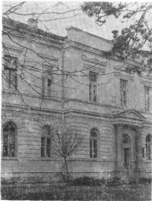
Зграда Сресног начелства у Мионици

нисмо видели учитељицу, јер су нас у зору потерали у Мионицу, говорећи да ћемо тамо добити храну и да ће нам ту суд судити.