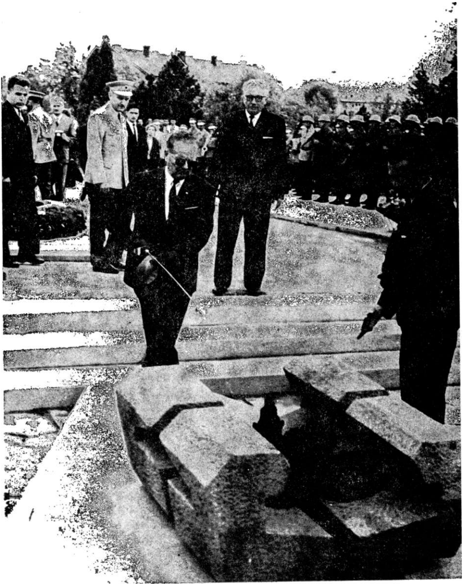
Председник Тито пали вечни пламен на спомен-комплексу на Крушину у Ваљеву