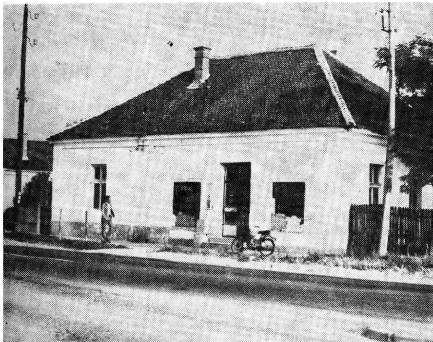
Кафана у Дивцима у којој је одржан састанак Драже Михаиловића са немачким официрима

Све се то догађа у време кад су четници имали велике губитке у борбама против партизана, које су сами изазивали. Нестало им је муниције, а ни оружја нису имали довољно. Деветог новембра четници су добили једну авионску пошиљку од Енглеза, али то ни изблиза није било довољно.