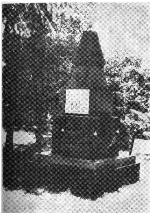
Споменик жртвама четничког терора у Брајићима