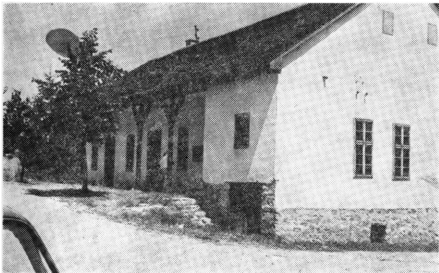
Брајићи, сеоска кафана у којој је одржан састанак Тита и Драже крајем октобра 1941. године

Многе су другарице певале држећи се храбро. Ја сам рањена у руку и одмах сам легла. Направила сам се да сам мртва. Када је пао мрак, извукла сам се из јаруге и побегла.