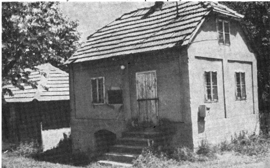
Жандармеријска станица у Брајићима, у којој је заседао четнички преки суд. Подрум ове зграде служио је као затвор и мучионица за заробљене партизана