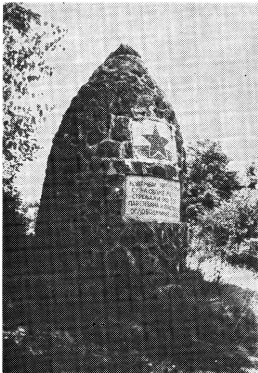
Споменик на Дреновом врху изнад Брајића — место где су четници масовно убијали заробљене партизана