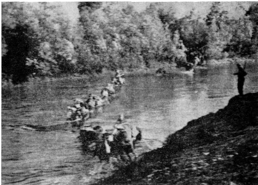
Прелаз ријеке Глине код Покупског јединица 39. дивизије (прољеће 1945. године)

У исто вријеме снаге 15. крајишке бригаде нападале су Бању Луку и упоришта на комуникацији Баша Лука — Босанска Градишка. Јединице 13. крајишке бригаде, у садејству са нама, нападале су гарнизон у Босанској Градишки са десне стране комуникације Босанска Градишка — Бања Лука.