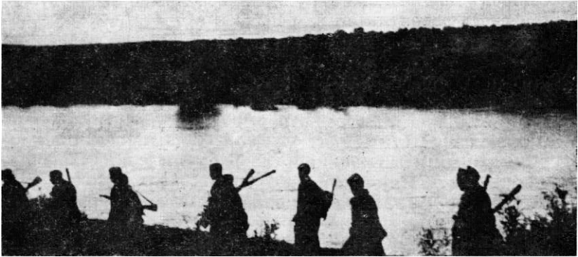
Прелаз 20. крајигике бригаде преко р. Купе и мари према Загребу (мај 1945. године)

који су радили на плановима и стручним пословима, а рат су провели у канцеларијама Министарства оружњаштва, и нису директно учествовали у спровођењу појединих усташких планова и операција. Вјероватно су због тога сматрали да нису ништа никоме криви, па су остали, а нису имали потребе да кажу да нису припадници усташке организације када је то већ било познато.