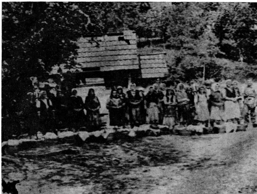
Народ Баније доноси храну борцима 20. крајишке бригаде (1. мај 1945. године)

25 км, са изразито слабо комуникативним тереном, због чега је маневар по фронту и дубини, са око 500—600 бораца, био веома отежан. С друге стране, од ових положаја до Босанске Дубице ваздушном линијом је око 35—40 км, а до Босанске Градишке око 70 км. На тој комуникацији се увијек налазило 1—2 батаљона.