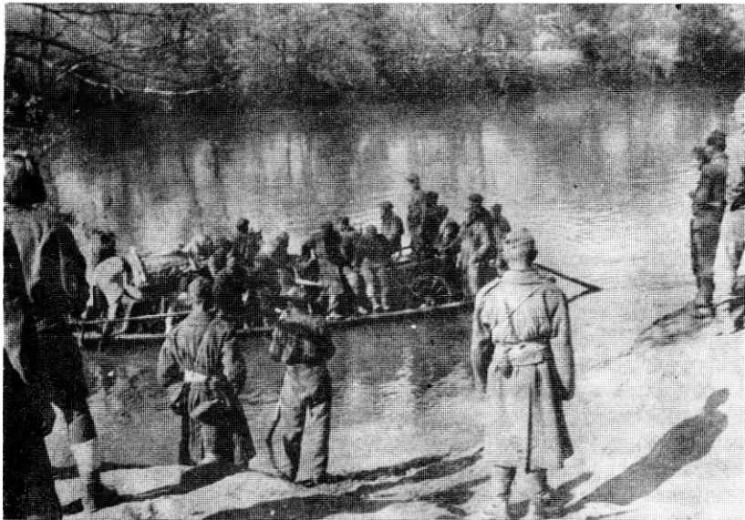
Преглаз преко разрушеног моста јединица 39. дивизије код Двора на Уни (мај 1945. године)

У међувремену, док смо се борили на овом сектору, пристигле су снаге, мислим, 28. славонске дивизије које су ослободиле Босанску Градишку и Босанску Дубицу и избиле према Добрљину. Имале су задатак да се пребаце на лијеву