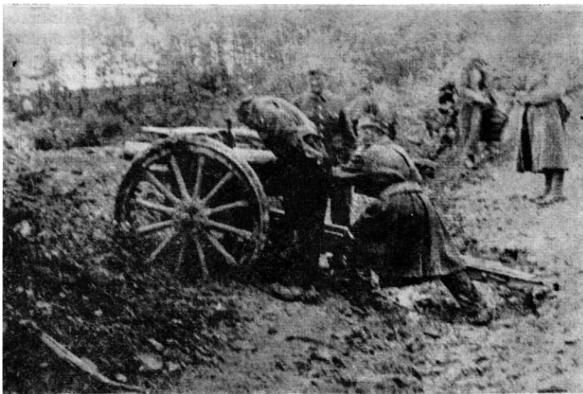
Дејство артиљеријског дивизиона 39. дивизије у борбама код Костајнице (прољеће 1945. године)

Козарчани су добро цијенили сваког ко није кукавица и ко је поштен, па чак и ако није храбар. Много су пажше посвјећивали спремности борца да се у борби жртвује за друга. Ко није био у сташу да се мјери са њима или да им призна да је плашљивији, није им могао доћи за комесара, командира и уопште, руководиоца. Једноставно, посебно су цијенили храброст и поштеште борца и руководиоца. Теорија и теоретска спремност морали су бити поткрепљени овим особинама и људским вриједностима.