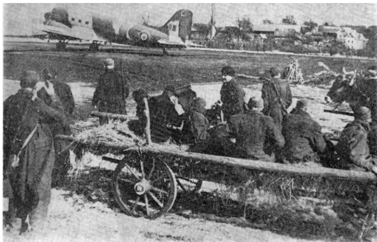
Pripreme za ukrcavanje ranjenika u avione na aerodromu Krasinec u Sloveniji

varano je sa aerodroma i drugih terena takođe svetlosnim signalima morzeovom azbukom. 100