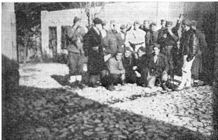
Grupa vazduhoplovaca sa teritorije 2. korpusa NOVJ, u Pljevljima 5. decembra 1943.

duhoplovstvu, nije se mogla ostvariti, jer kratkoća vremena, obimni programi i kompletno školovanje to nisu dozvoljavali. 128