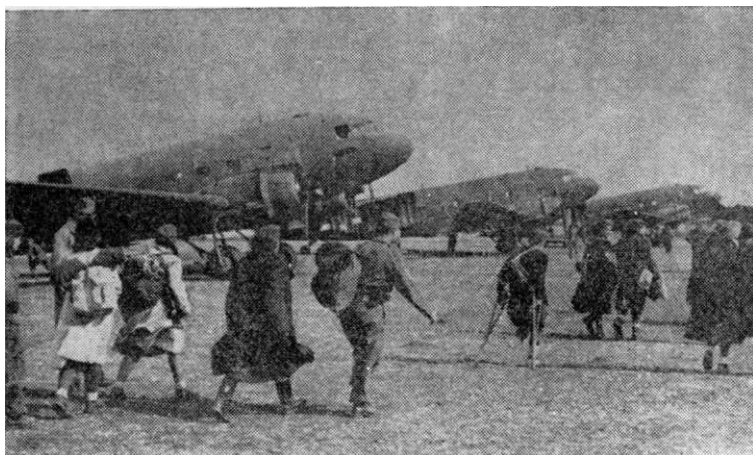
Iskrcavanje ranjenika na aerodromu Bari u Italiji

od 600.000 boraca. Pa ipak materijalna pomoć, prebačena avionima, sa zahvalnošću je prihvatana. I ona je imala udela u naporima za pobedu zajedničkog neprijatelja. I kroz nju se manifestovala solidarnost saveznika. Ali je bila mala, pa je naša armija i dalje morala sopstvenim snagama da obezbeđuje: oružje, municiju, hranu, odeću, obuću i druge potrebe.