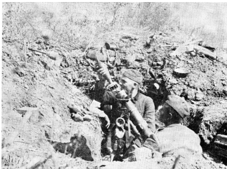
Минобацачко одељење дејствује на сремском фронту (12. IV 1945.)

Према овом плану, Двадесет друга дивизија је добила наређење да реку Босут форсира у току ноћи 11. априла (на одсеку 2 км источно од Липовца код Батровца), а 12. априла нападне непријатеља у селу Аршевац и опречи његовим деловима извлачење ка селу Подграђе. 35 Штаб Двадесет друге дивизије је на основу овог задатка издао 11. априла своју заповест којом је одредио 8. стрељачкој бригади да форсира реку Босут