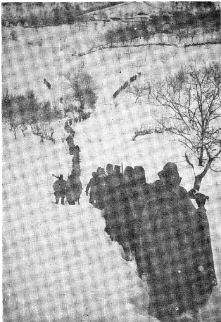
1. батаљон 8. српске бригаде на маршу од Ужица према Вардигиту 18. I 1945.