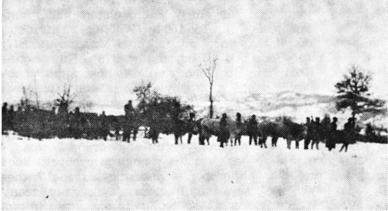
Пребацавање дивизијске артиљерије у рејон Дрмне уз помоћ воловске запреге

У вези с том ситуацијом, Двадесет друга дивизија је 13. фебруара наредила: да 8. бригада из рејона Млађевац—Липља—Марчић продире левом обалом Дрине;