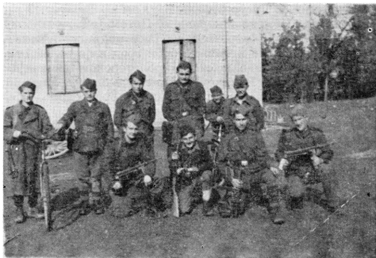
Рума, октобар 1944: штаб 1. батаљона са куририма.

Непријатељ се утврдио на линији села: Гргуревци — Шуљам — Бешеново — Велики Радинци — Сремска Митровица, користећи канале и три линије ровова. 135 Око Митровице подигао је већи број бункера, а у насељу многе зграде подесио за одбрану; поред тога, на појединим правцима поставио је минска поља и жичане препреке. Одбрану Митровице организовали су делови 12. СС дивизије и 150. алпске моторизоване дивизије; пук Српског добровољачког корпуса; око 25 тенкова; око 2 артиљеријска дивизиона, као и нешто полицијских снага. При нападу 16. дивизије 31. октобра у граду је било 1.000, војника подржаних ватром артиљерије из Лаћарка.