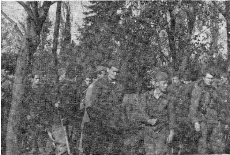
Рума, октобар 1944: група батаљонских и четних руководица 4. војвођанске бригаде.

количину муниције, одеће и хране: сопствени губици 2 мртва и 11 рањених.