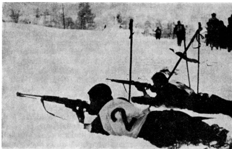
20. januar 1945. u Cerknu. Takmičenje partizanskih skijaških patrola. Patrola Prešernove brigade osvojila prvo mesto.

nacističke Nemačke i njenih saveznika, kao i u to da se njihovi očevi, braća, sinovi i muževi mogu spasiti samo na taj način ako pobegnu od domobrana u partizane.