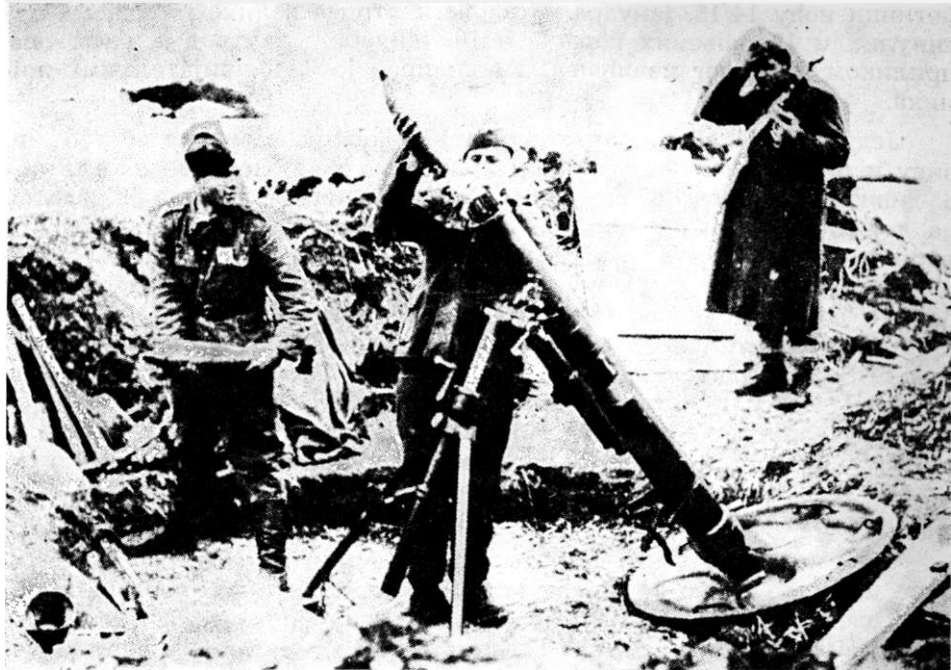
Посада МБ — 120