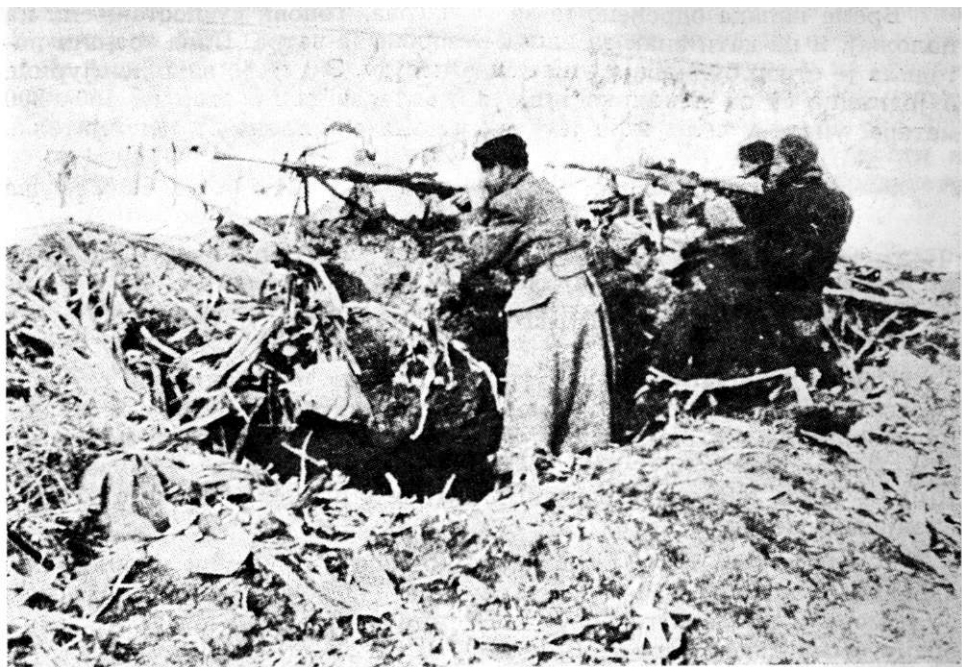
Г р у п а б о р а ц а п а п о л о ж а ј у С р е м с к о г ф р о н т а п р о л е ће 1945. г о д и н е

на село Сољани. После неколико узастопних јуриша, и поред снажне артиљеријске подршке, батаљон није успео да упадне у село, претрпевши при томе осетне губитке. Непријатељ се очајно бранио. Нарочито ефикасно је тукао брисани простор на прилазима селу јаком митраљеском ватром из бункера и са торња сеоске цркве. Било је очигледно да у следећем нападу треба ефикасније неутралисати ватру из бункера.