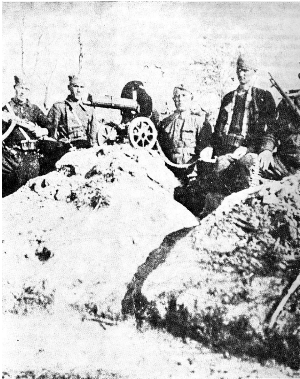
Борци литраљеске чете 1. батаљона „Велебит“ на положају код Илинача март 1945. године

280 чна обука и политичка настава. Борци су обучавани у руковању оружјем, гађању и другим војним вештинама. Читава војностручна обука била је подређена непосредним борбеним задацима на фронту.