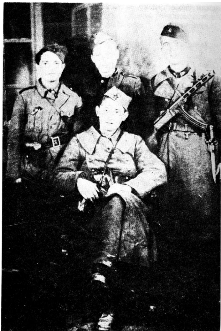
Делегати 1. кон- греса У С А О С - а Новембар 1944. године у Београ- ду

Другог дана рада Конгреса, делегати су упознати са поруком из војне болнице у Београду, где се налазио велики број рањених бораца, да је нестало крви за његово успешно лечење. С тим у вези, апеловало се на делегате да, који то желе, дају крв за рањене борце. Док се правио списак добровољних давалаца крви, настала је неопи-сива гужва. За врло кратко време јавило се преко 800 делегата.