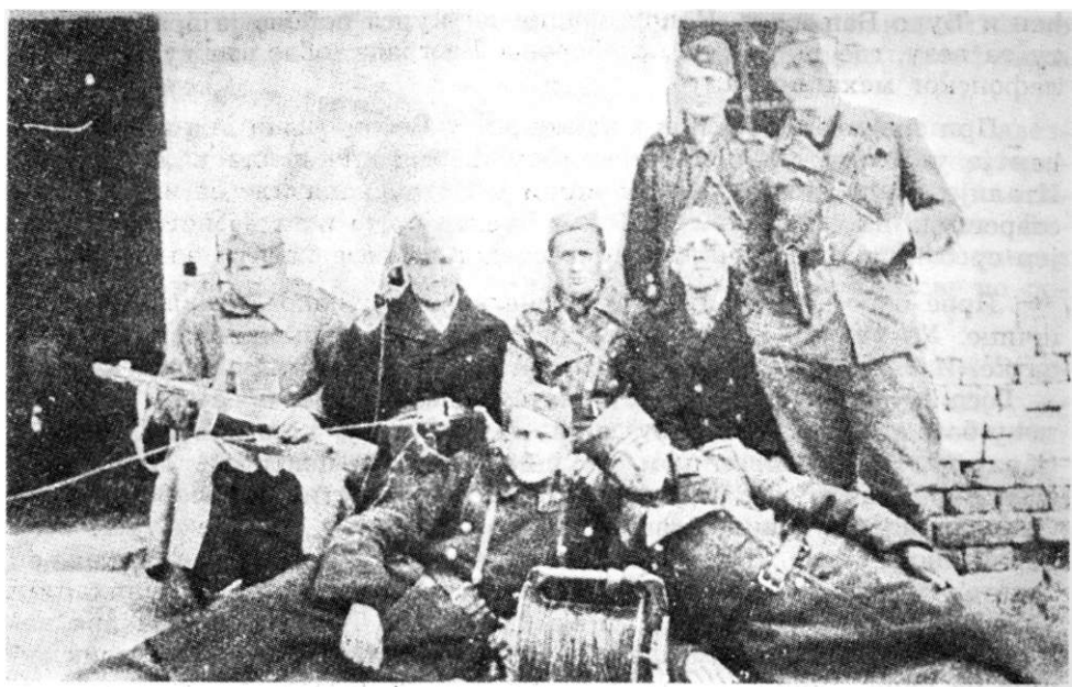
Везисти 3. Личке бригаде