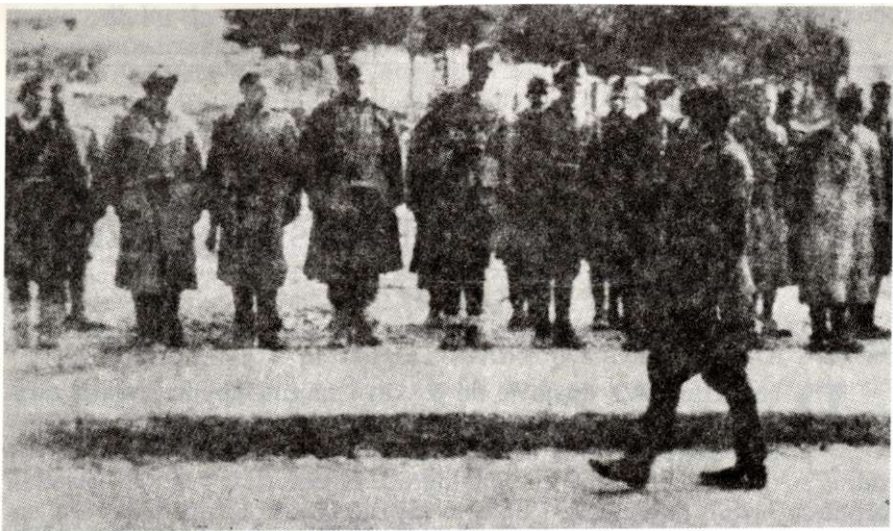
Vrhovni komandant Josip Broz Tito vrši smotru 4. bataljona 3. krajiške brigade u oslobođenom Bihaću, novembar 1942.

Oslobođenjem Bihaća stvorena je velika povezana slobodna teritorija na području Bosne i Hercegovine i Hrvatske. Stvoreni su svi uslovi za održavanje Prvog zasjedanja Antifašističkog vijeća narodnog oslobođenja Jugoslavije.