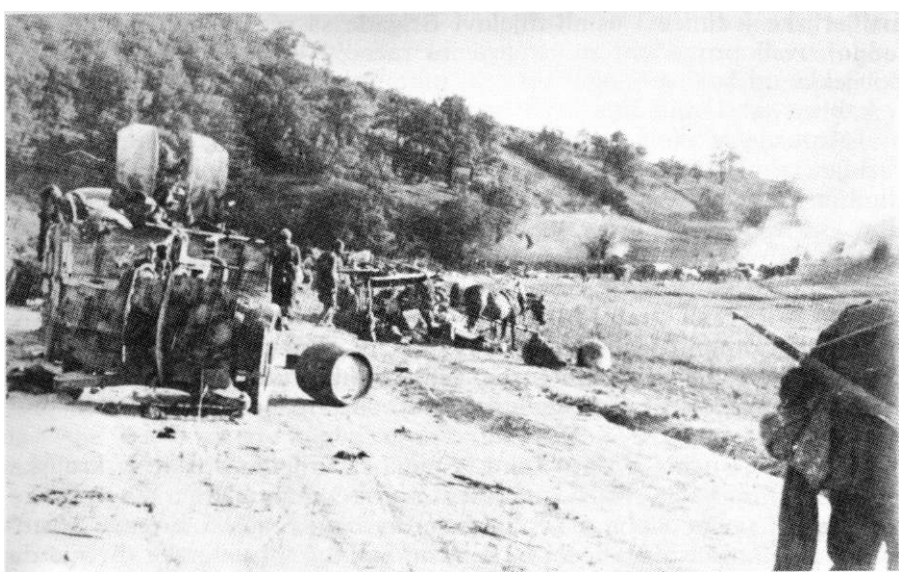
Prikupljanje plena kod sela Šestine (Zagreb), 8. maj 1945.

do vrlo žestoke borbe. Za vrijeme povlačenja, u rejonu sela Breznica i Hum i na komunikaciji prema Zlatar Bistrici, neprijatelj je zapalio preko 150 vozila i uništio nekoliko desetina topova i teških minobacača, a pešadijom nastavio užurbano povlačenje. Zatim su 17. i 16. divizija produžile gonjenje neprijatelja u pravcu s. Mihovljan. 899