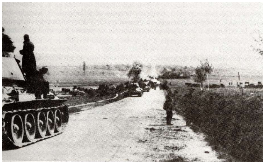
Borci 3. krajiške brigade i Tenkovske brigade JA pred napad na neprijateljski garnizon u Pleternici, april 1945.