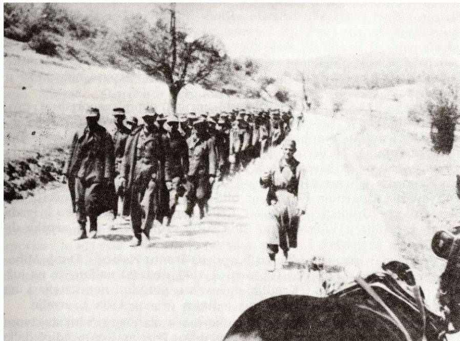
Grupa zarobljenih Nemaca u selu Ruševu (Dilj), 15. aprila 1945.