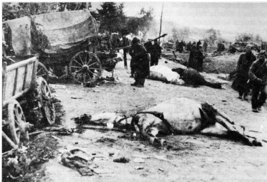
Posle razbijanja ustaške bojne kod sela Šestine (Zagreb), 8. maj 1945.

Zagrebačke gore i dalje prema Mariji Bistrici. Brigada je krenula 8. maja u 2 časa iz Novog Mjesta. Čim je čelo kolone prešlo put Sesvete - Sveti Ivan Zelina, naišlo je na snažan otpor neprijatelja. Za borbu su se razvili 2. i 3. bataljon i, poslije kratkotrajne borbe, razbili neprijatelja koji se povukao u s. Berislavce, malo se sredio i prešao u protivnapad, koji su 1. i 3. bataljon energičnim dejstvom odbili i produžili pokret.