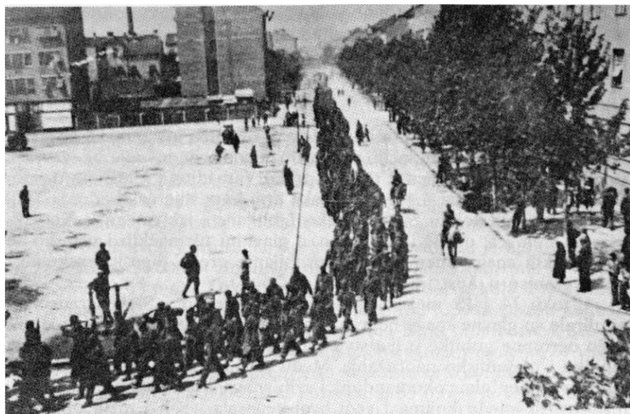
Jedinice 2. bataljona 3. krajiške brigade ulaze u Zagreb 10. maja 1945.

Devetog maja 1945. poslednjeg dana borbe, rukovodeći kadar brigade sačinjavali su: