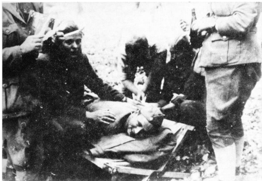
Sanitetsko osoblje brigade zbrinjava ranjenike za vreme borbi za Pleternicu, april 1945.

Prva proleterska brigada bez 3. bataljona, imala je 76 poginulih i 235 ranjenih. 880