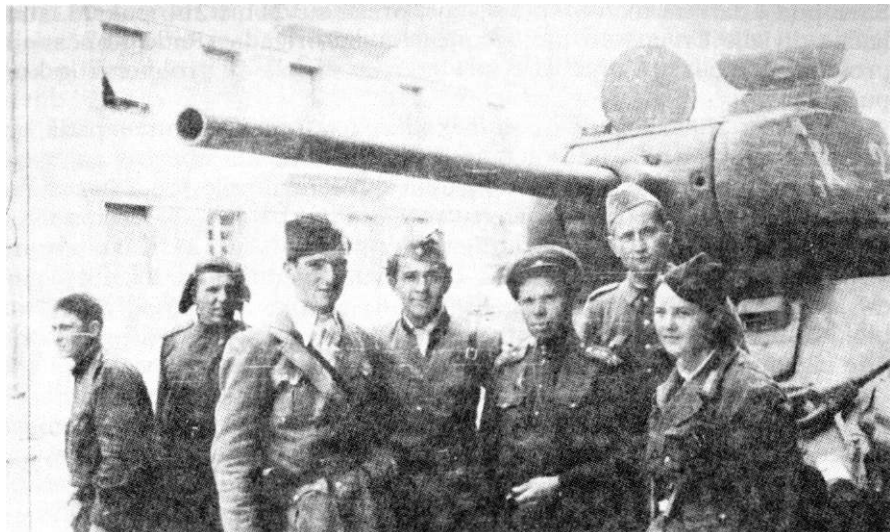
Starešine i borci Crvene armije i 3. brigade pored jednog od sovjetskih tenkova. U Beogradu 18. oktobra 1944.