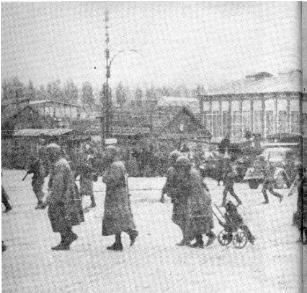
Motomehanizovane jedinice Crvene armije pred uvođenje u borbe za oslobodenje Beograda, oktobar 1944.

ma Zoološkom vrtu i Kalemegdanu; 3, 4. i 5. bataljon između 2. i 1. bataljona prema Zavodu za izradu vojne deće, dok je bataljon »Mateoti« zadržan u rezervi u rejonu Bajlonove pijace i ulice Džordža Vašingtona. Pozadinski dijelovi i sanitetski organi Brigade zadržani su na Voždovcu. Štab Brigade nalazio se u Cetinjskoj ulici. Ovakav raspored ostao je sve do konačnog oslobodenja Beograda.