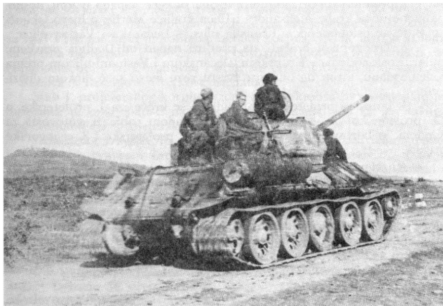
Borci brigade na tenku Crvene armije na putu od Ralje prema Avali i Beogradu, oktobra 1944.