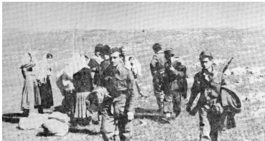
Pripadnice AFŽ-a dele poklone borcima bataljona »Mateoti«. U Sandžaku avgusta 1944.

brigadi oko dvije godine i s njom prešli slavan put kroz borbe i okršaje koje je vodila u dvogodišnjoj borbi. 696