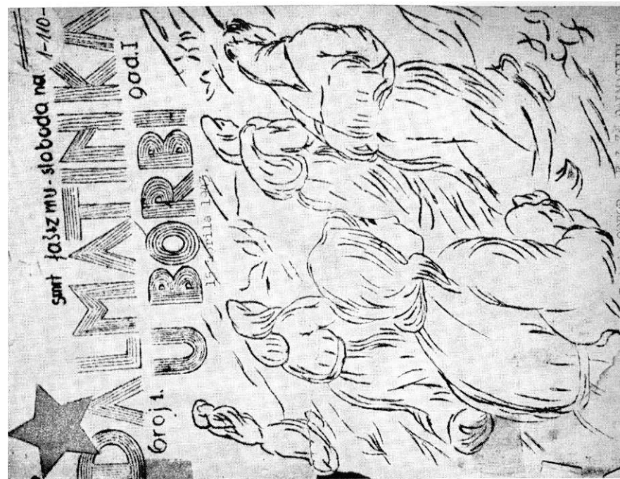
Naslovna strana prvog lista »Dalmatinka u borbi«, rad slikara Joke Kneževića. Mostar, travnja 1943.