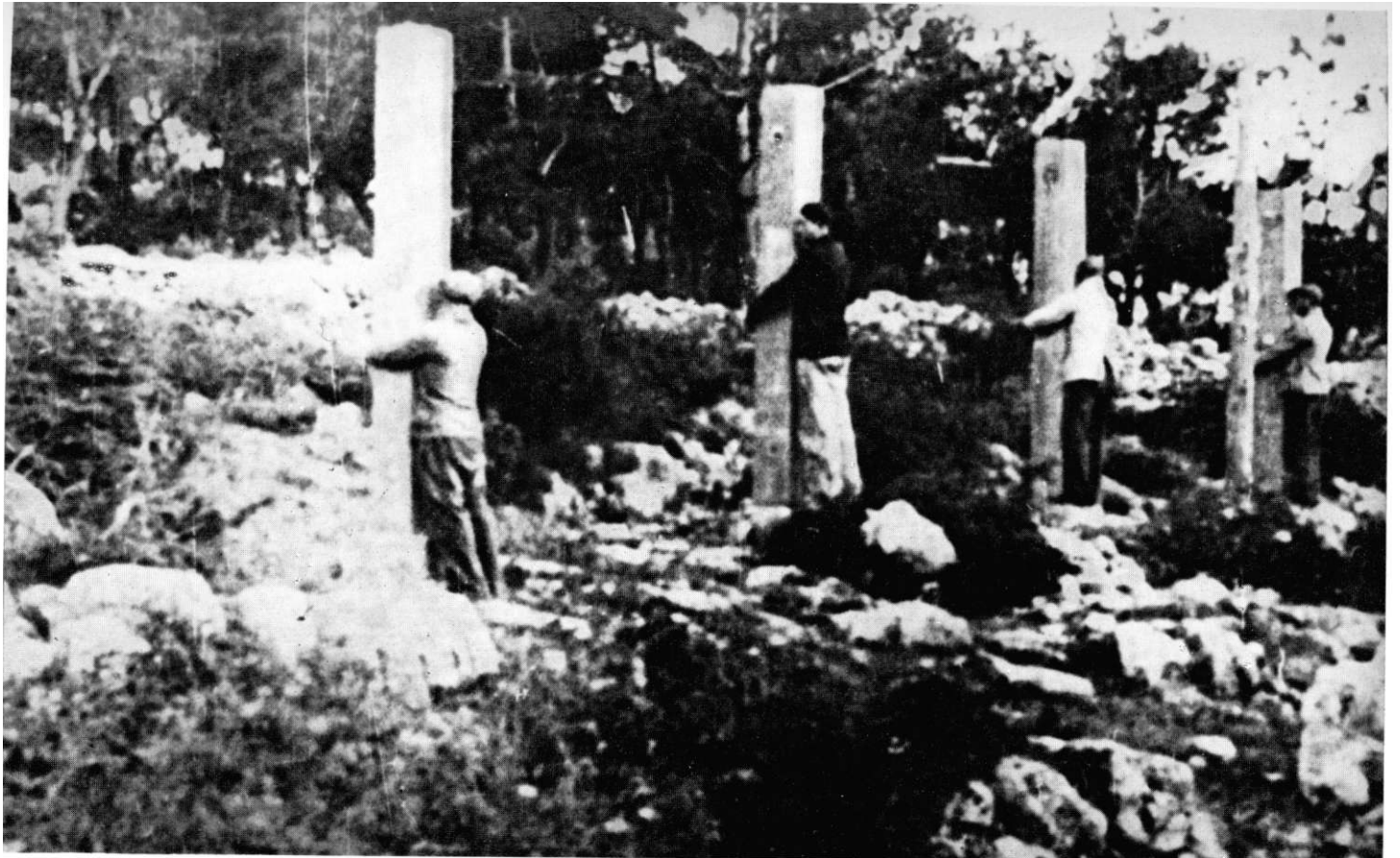
Strijeljanje R. Končara i drugova na Subićevcu 22. V 1942.