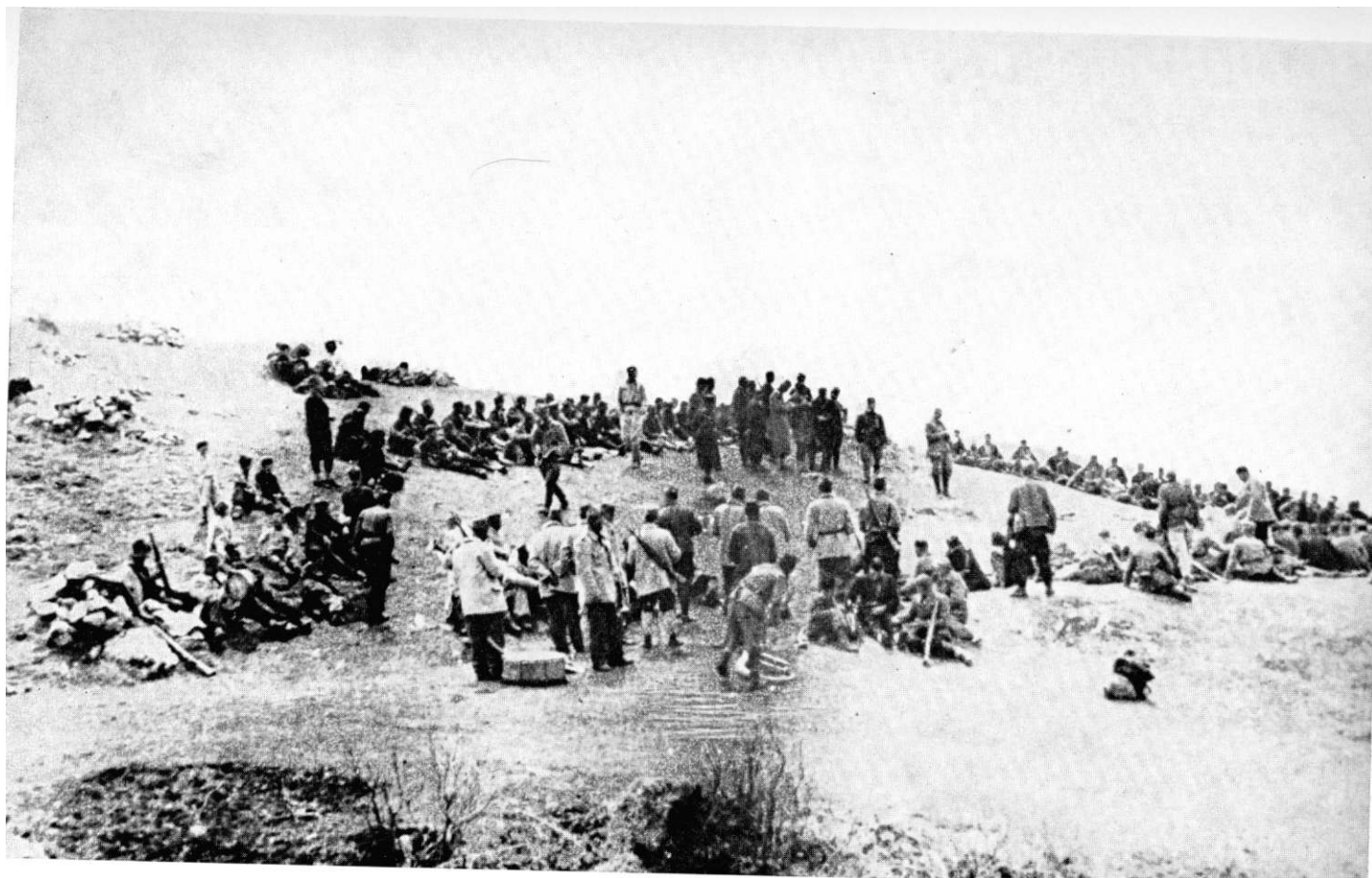
Borci Prve proleterske i Druge dalmatinske brigade, Vučevo, juna 1943.