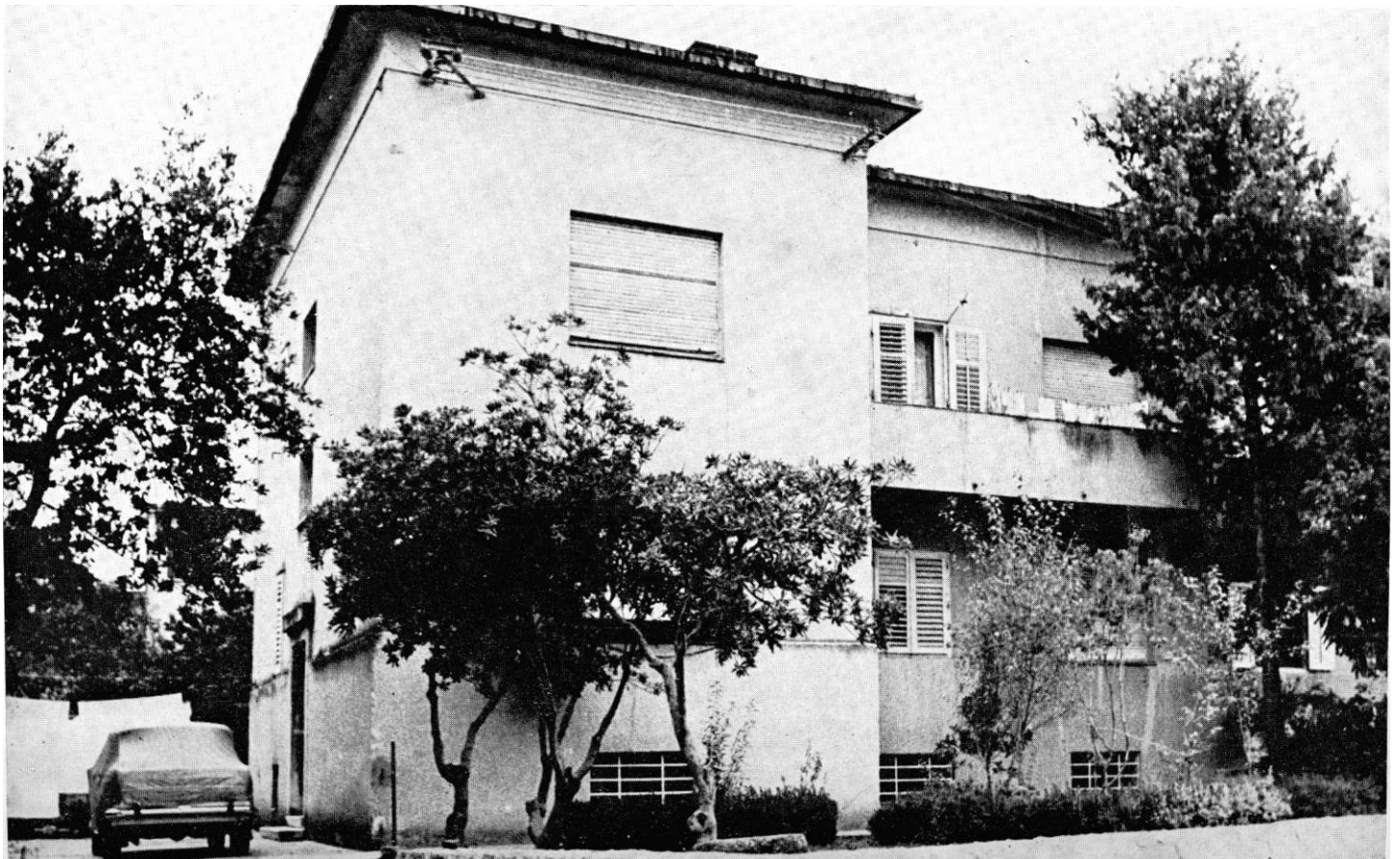
Kuća u Kvaternikovoj ulici br. 30, u kojoj je pod terorom fašističke okupacije 6. travnja 1942. održano prvo zasjedanje NOO-a grada Splita