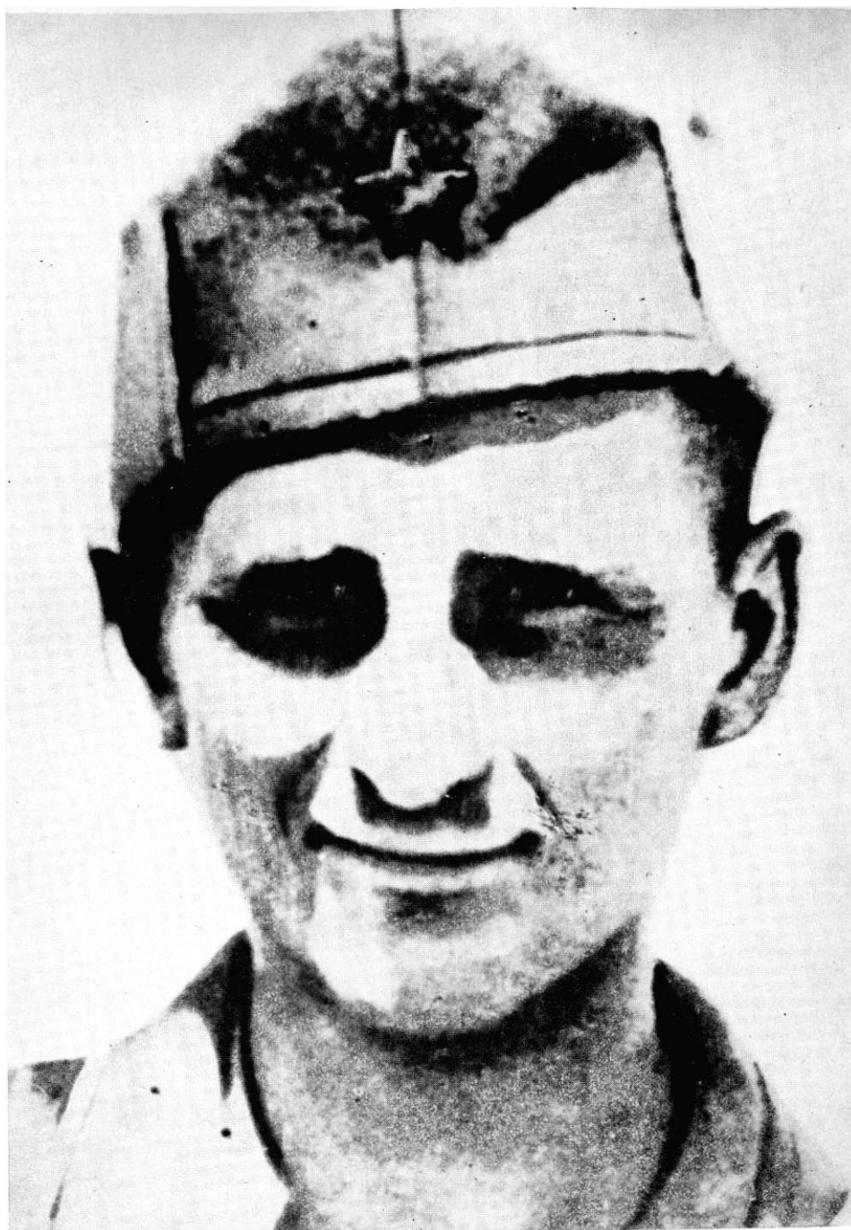
Ante Jonić, istaknuti skojevski i vojni rukovodilac, junački poginuo na Vagnju 5. kolovoza 1942. U srpnju 1943. proglašen narodnim herojem, prvi iz Dalmacije