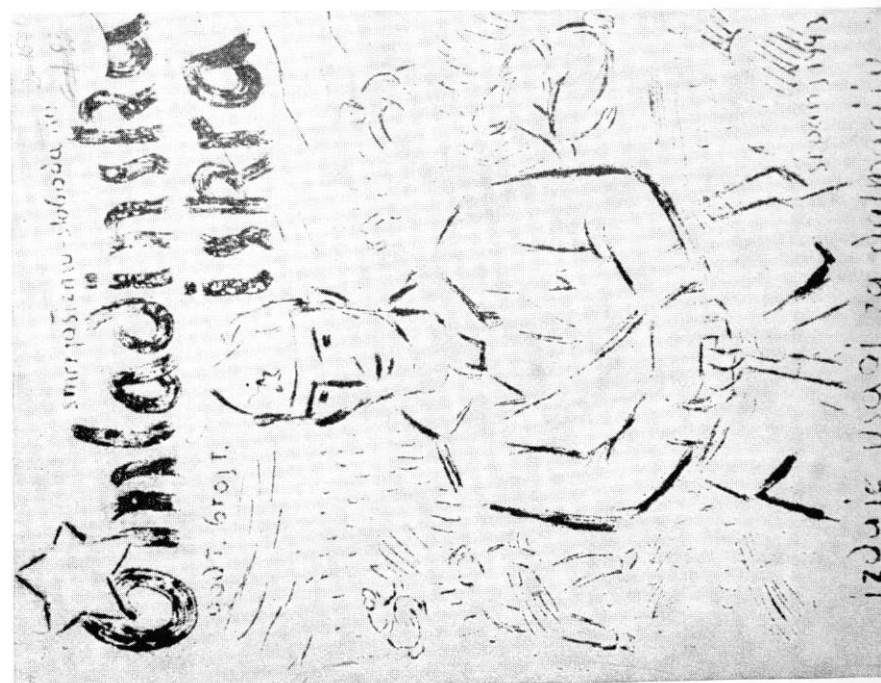
U srpnju 1943. počeo je u Simu Gornjem na Mosoru izlaziti list »Omladinska iskra«