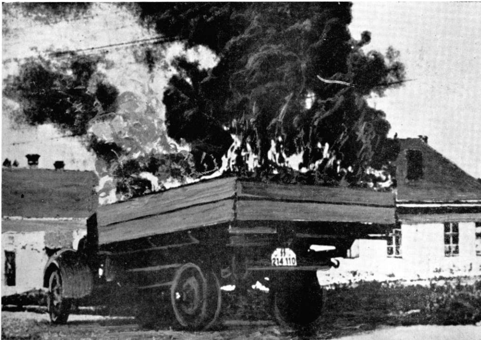
Овако су београдски ударници већ јула 1941. почели борбу против окупатора. Немачки камион у пламену.