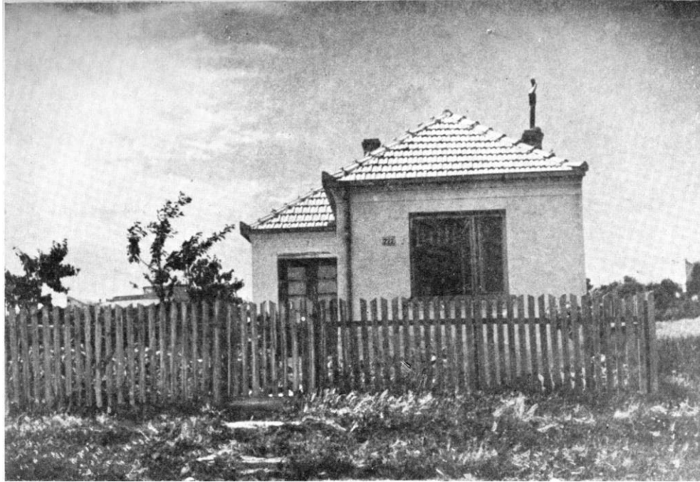
Зграда звана „Перивој”, илегално склониште у Кумодрашкој улици 222