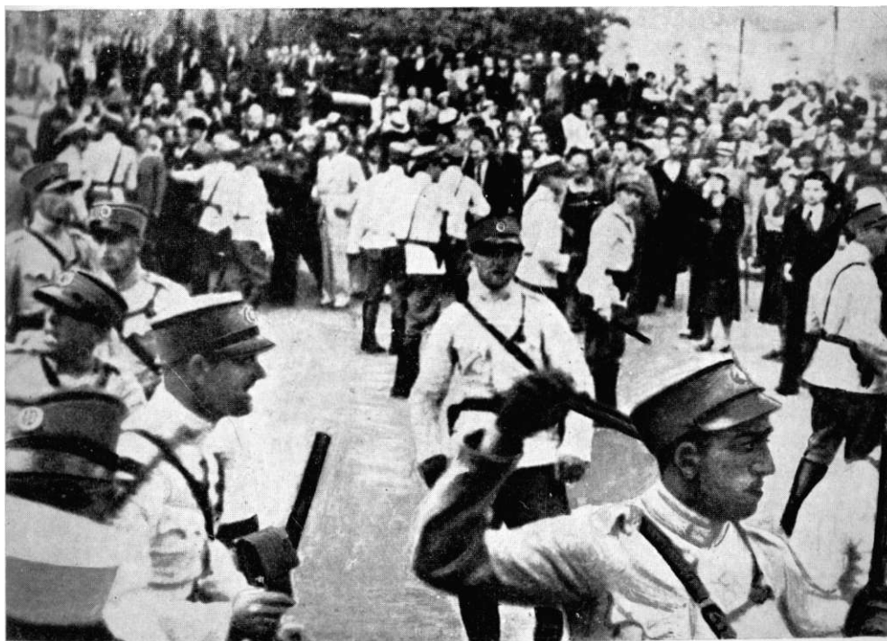
Краљевски жандарми у акцији против многобројних демонстраната у једној од демонстрација 1938—1940. године