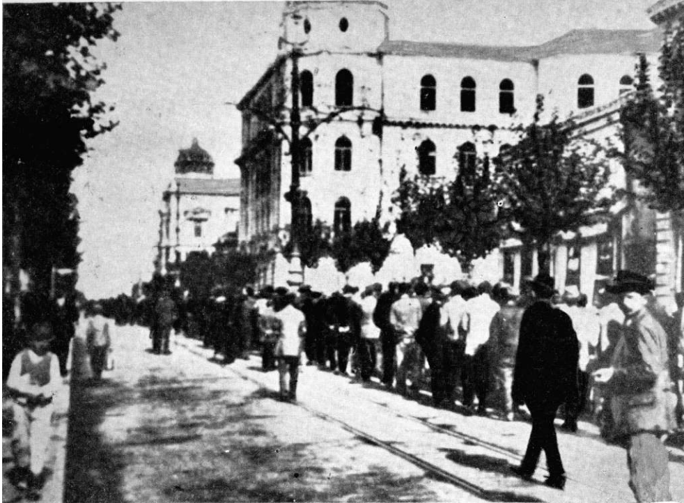
Велики штрајк железничара априла 1920. године. Поворка у пролазу поред двора