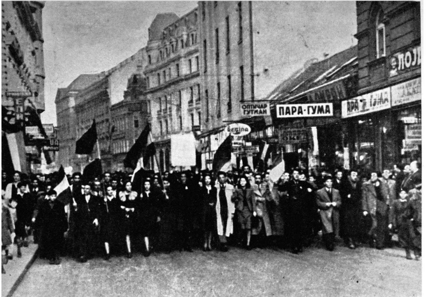
27. марта 1941. у улици Кнеза Михаила