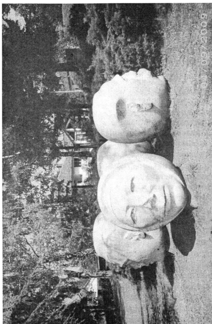
Оштећене бисте народних хероја : Милана Благојевића, Даринке Радовић, Милић Радовановића и Софије Ристић у Тополи