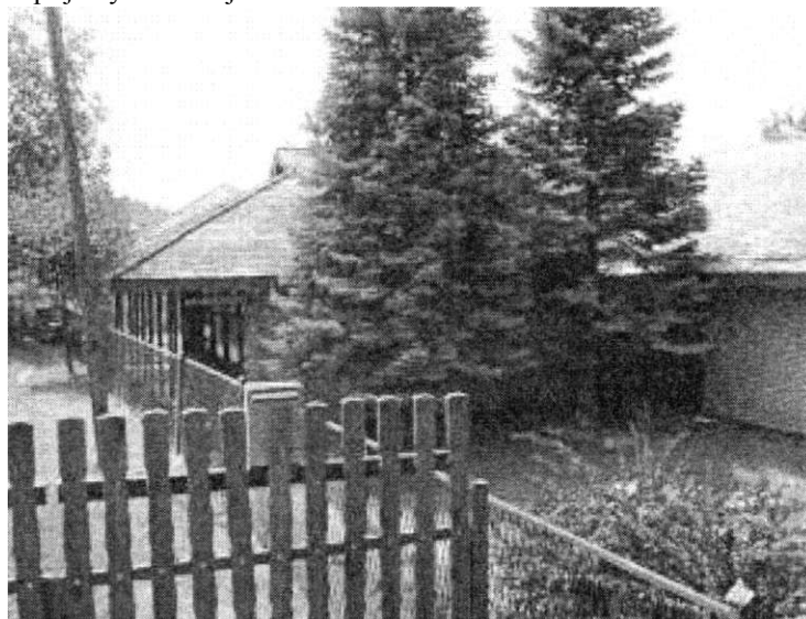
Дечји вртић „Софија Ристић“ у Тополи