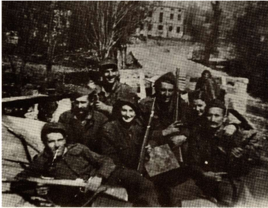
После успешне акције у Ботуну