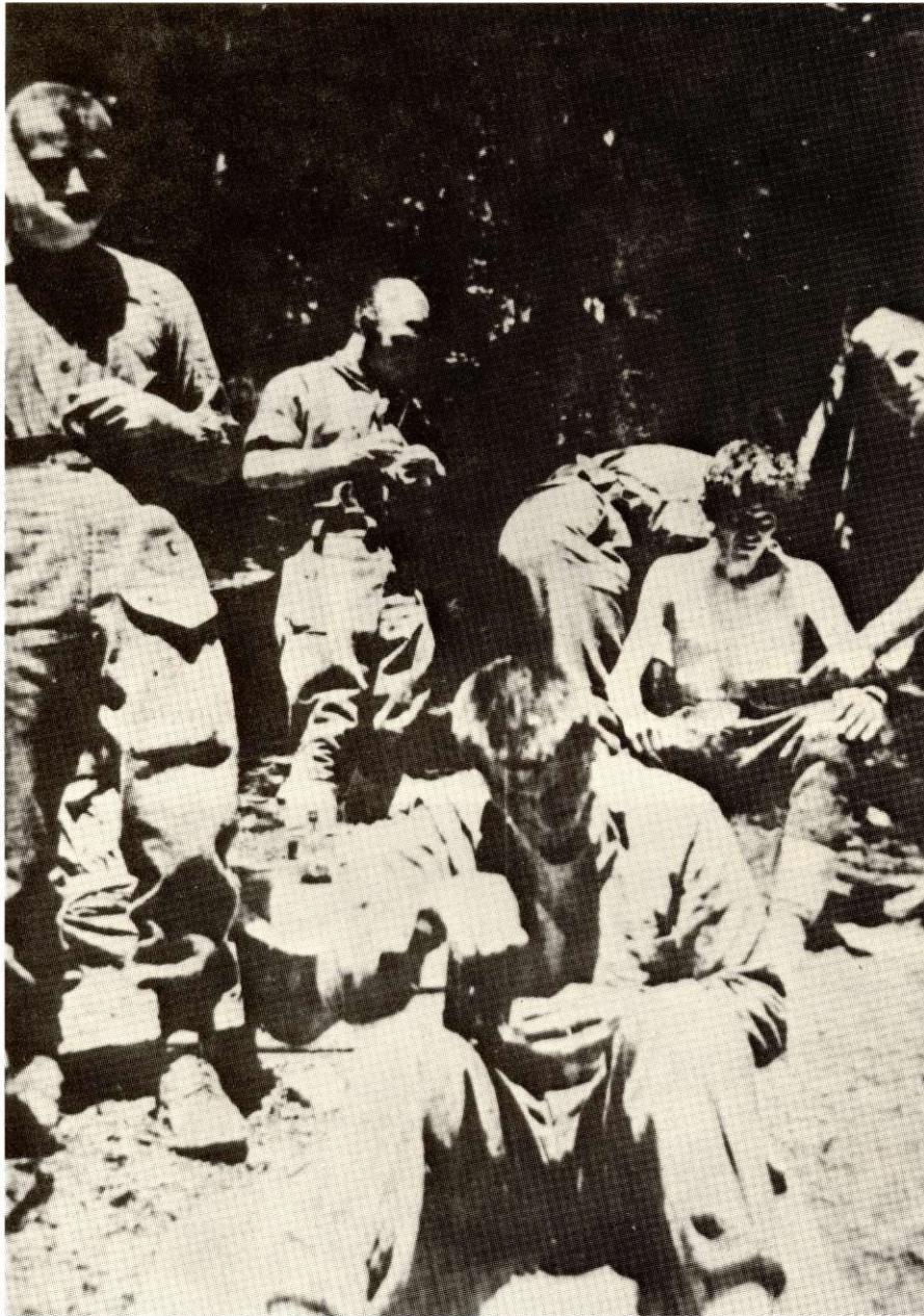
Болница на Караорману