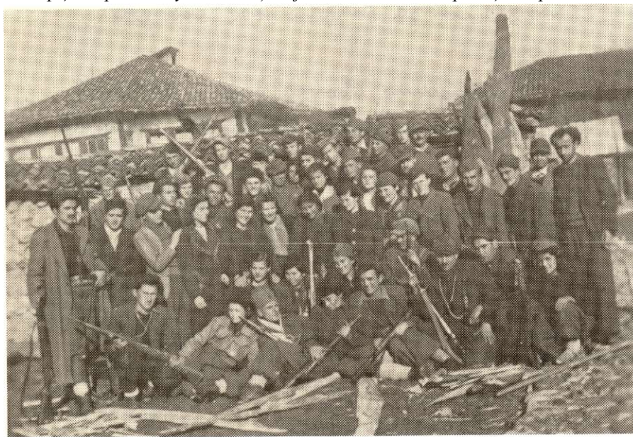
Борци бригаде у ослобођеној Пећи, новембар-децембар 1944.