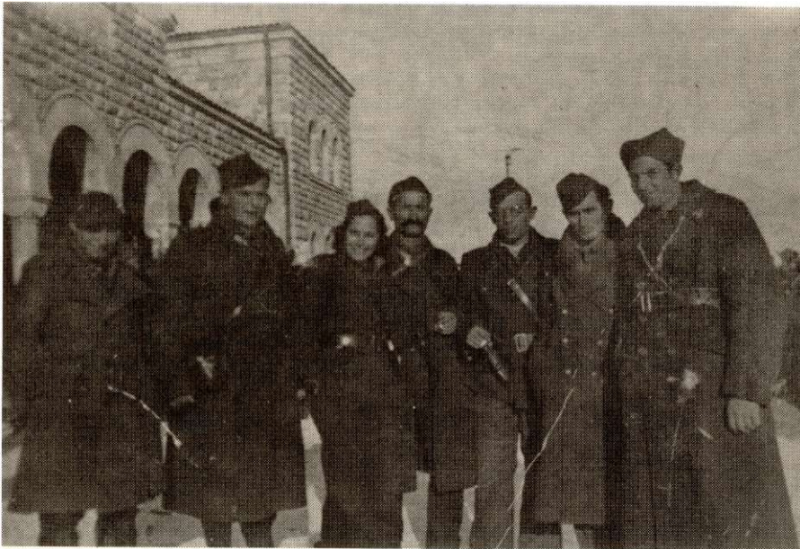
Штаб бригаде пред полазак у Дреницу