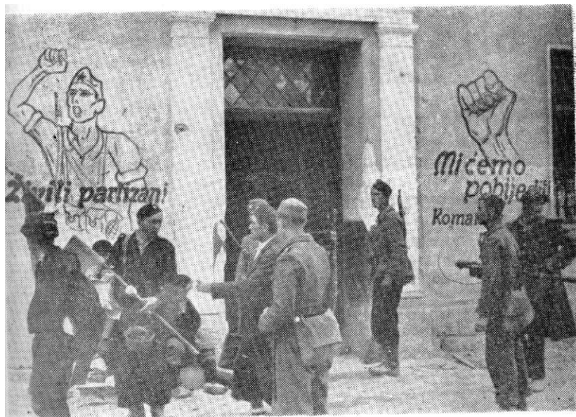
Po ulasku u Duvno ustaše skidaju partizansku zastavu sa zgrade Komande mesta (28. jula 1942).