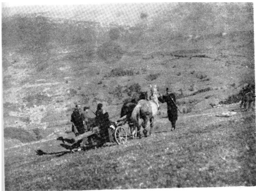
Protivkolski top jedne proleterse brigade odlazi na položaj.