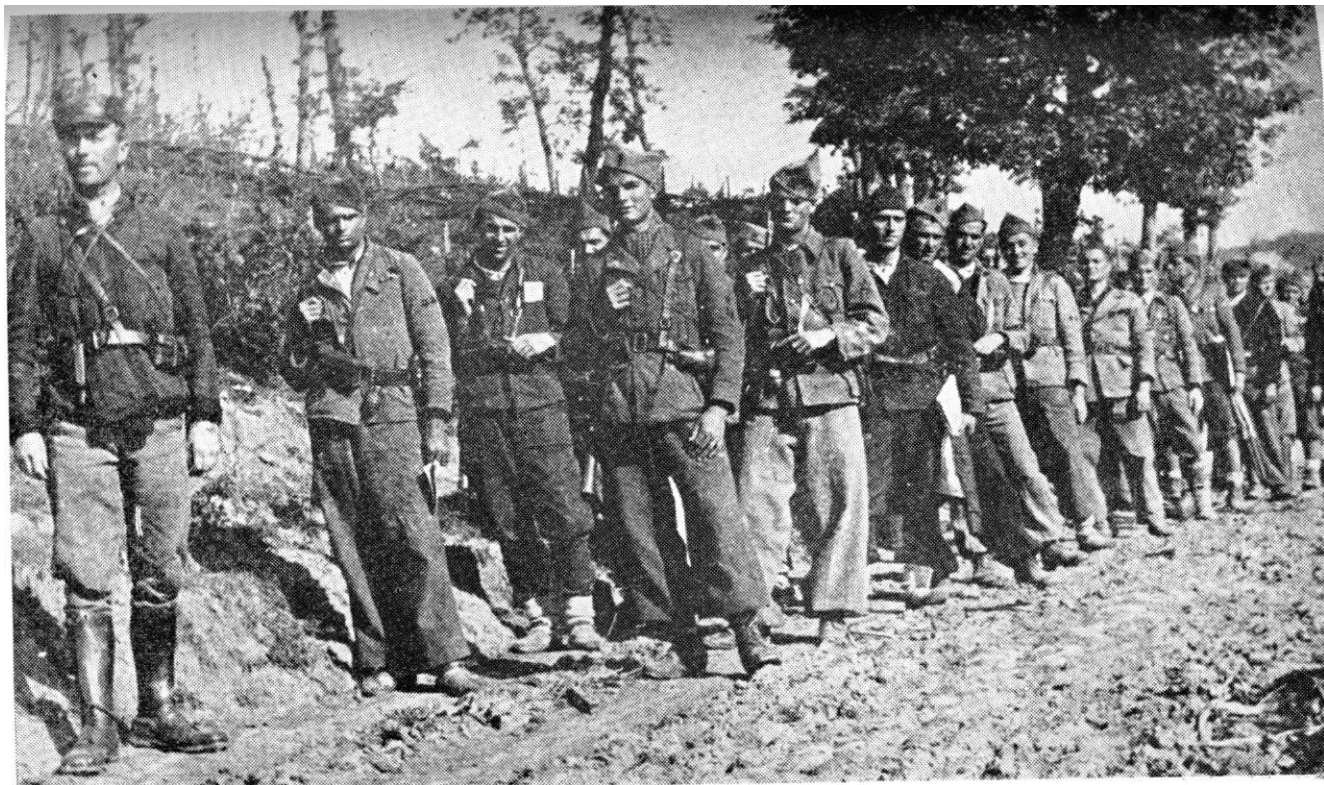
Bataljon »Vojin Zirojević« na Slavinu, kod Livna, avgusta 1942.