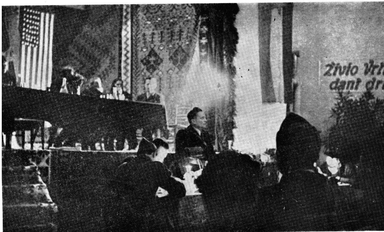
Vrhovni komandant NOV i POJ Tito govori na Prvom zasedanju AVNOJ-a u Bihaću, 27. novembra 1942.