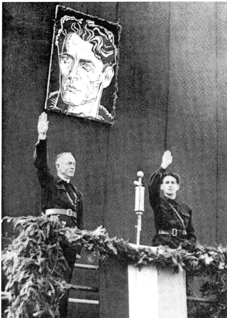
Savez između Antoneskua i Gvozdene garde. Antonesku (levo) i Horia Sima na jednoj pobjedničkoj paradi Gvozdene garde u Bukureštu, u oktobru 1940. Obojica nose zelene legionarske košulje. Iznad njih se vidi portret ubijenog Kodreanua