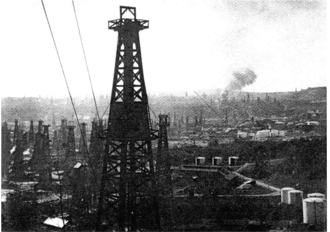
Rumunska naftonosna polja - srce nemačkog snabdevanja gorivom. O njima je bilo reci prilikom stvaranja pakta gorivo-za oružje. Na slici: Naftonosna polja kod Morene