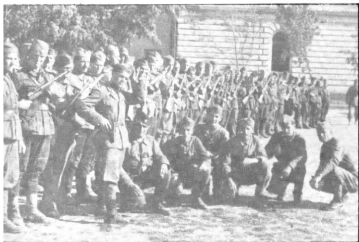
Борци 2. батаљона, по завршетку рата.