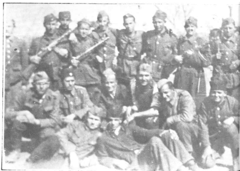
Група бораца бригаде, СФ — — 1945. г.