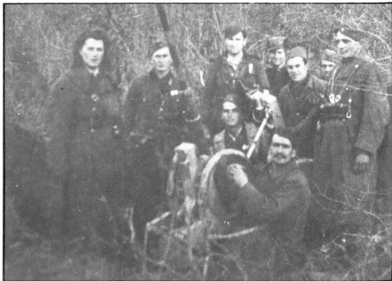
На положају код Белатоваца децембра 1944. године.