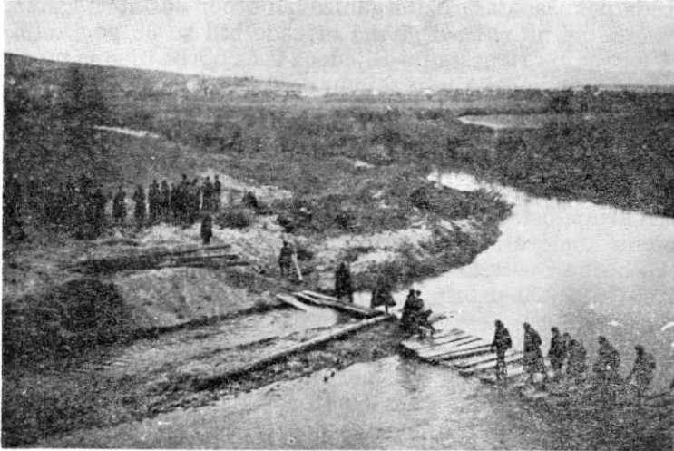
April 1945. Prelaz preko r. Orljave

Pravac daljnjeg gonjenja neprijatelja ka granici za našu brigadu bio je: s. Slobodnica — s. Pleternica — Slavonska Požega — s. Kamensko — s. Spanovica — Pakrac — s. Trojeglava — s. Dežanovac — s. Končanica — Mala i Velika Barna — s. Mali i Veliki Grđevac — s. Nova Ploščica — s. Berek — s. Sveti Ivan Zabno — s. Brezovica — s. Komin — s. Bedekovčina — s. Veliko Trgovište — s. Kumrovec — s. Kozje — s. Sv. Juraj, da bi 13. maja 1945. izbila u širi rejon Celja.