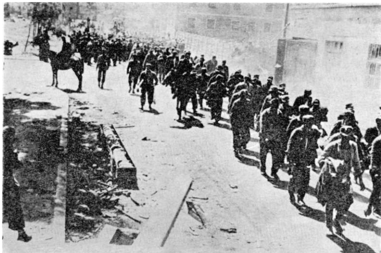
13. maj 1945. Celje. Kolona njemačkih vojnika odlazi u zarobljeničke logore

Za zasluge u NOB-u i revoluciji 5. brigada je odlikovana: Ordenom, narodnog oslobođenja, Ordenom bratstva i jedinstva I reda, Ordenom partizanske zvezde I reda i Ordenom zasluge za narod I reda.