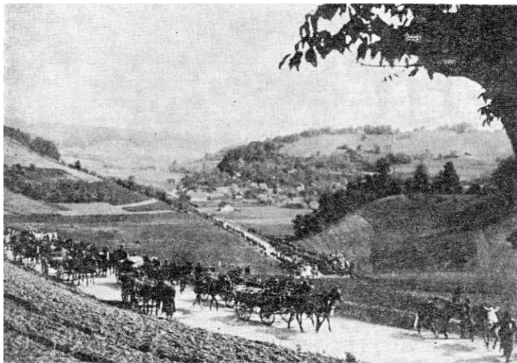
Maj 1945. Kolona 5. kozaračke brigade kroz Hrvatsko Zagorje

pa-mitraljeza, 32 topa raznih kalibara, 795 kamiona i automobila, 100 motocikla i velike količine municije i ostalog ratnog materijala.* 35