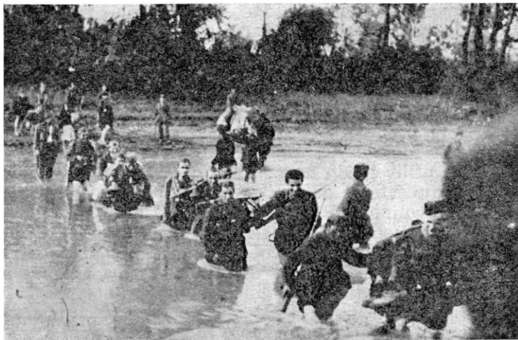
Borci 5. brigade prelaze Kolubaru oktobra 1944.

tekle nepregledne kolone naših jedinica, koje je narod oduševljeno pozdravljao. U svakom selu praznik i narodno veselje. Bio je to veličanstven i nezaboravan prizor. U popodnevnim satima 14. oktobra 1944. borci 5. brigade ugledali su mnoštvo krovova velikog grada, koji su plamtjeli na zracima jesenjeg sunca.