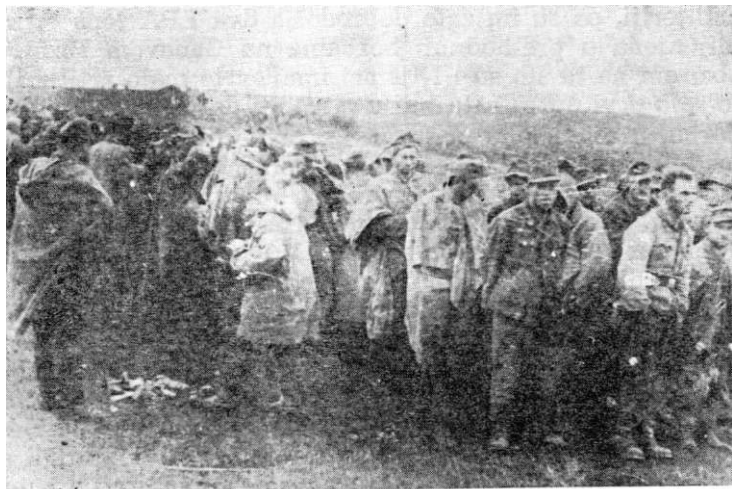
Zarobljeni Nemci pod Avalom oktobra 1944.

Nijemci su, mada u bezizlaznom položaju, pružali očajnički otpor, čak i kada je to postalo besmisleno. Otpor su pružali i ranjenici, odbijajući sve pozive na predaju. Međutim, borbeni elan i zanos naših boraca bio je veliki i ništa ih nije moglo zadržati u jurišu.