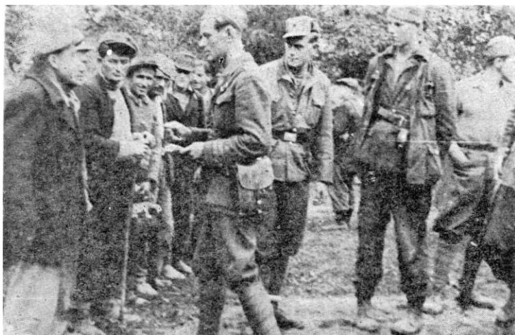
Septembar 1944. kod Krupnja u Srbiji. U brigadu se dobrovoljno javilo oko 100 omladinaca

jedinica što su nastupale od Valjeva. Borba je trajala do predveče 19. septembra 1944, kada su jedinice 5. brigade bile prisiljene da napuste Krupanj i izvuku se na visove zapadno i sjeverozapadno od njega. Jednom dijelu ovih četničkih snaga uspjelo je da se noću 19/20. septembra 1944, obišavši desno krilo 5. brigade, probije ka Drini i prebaci u Bosnu. Ostatak ovih snaga odstupio je prema Iverku i Ceru. 21. septembra 1944. uhvaćena je veza sa ostalim našim jedinicama i od toga dana 11. divizija je u sastavu 12. korpusa. 367 U trodnevnim borbama oko Krupnja, gubici brigade bili su 14 poginulih i 15 ranjenih. Zarođeno je 20 četnika, dok ih je veliki broj poginuo. 384