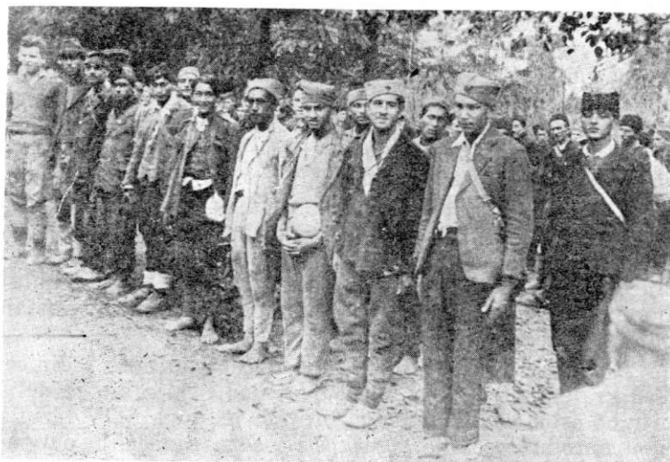
Mobilizacija novih boraca u Mačvi, oktobra 1944.

jateijem. U Krupnju je formirana komanda mjesta i manji partizanski odred. Prema naredenju štaba 12. korpusa od 25. septembra 1944. 369 sve jedinice korpusa (11. 16. i 36. divizija) otpočele su pokret ka Mačvi, Ceru i Pocerini, sa zadatkom razbijanja neprijateljskih snaga i oslobođenja ovog dijela Srbije. Izvršavajući svoj dio zadatka, 5. brigada je nastupala pravcem Krupanj — Draginac — greben Iverak (k. 426) — Kosanin grad (k. 687) — s. Petkovića — s. Varna i u s. Vranjska izbila 28. septembra 1944. u popodnevnom časovima. 370 Četnici nisu pružili nigdje ozbiljniji