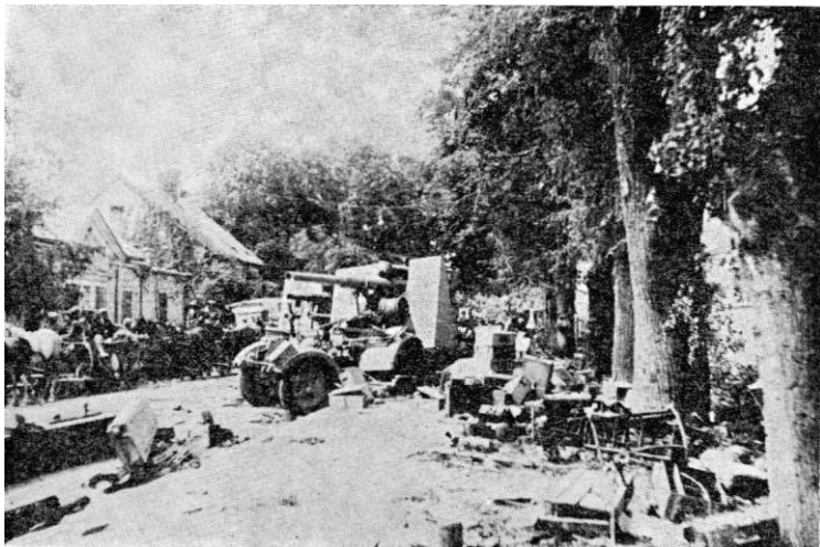
Oktobar 1944. Zaplijenjena njemačka artiljerija na Banovom Brdu