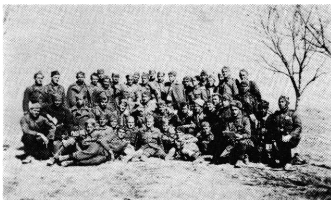
Partijska organizacija 3. bataljona u rejonu Sida, nekoliko dana pred proboj sremskog fronta