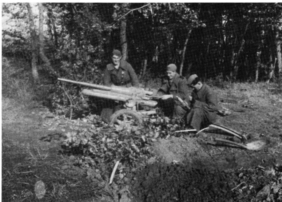
Protivtenkovski top na vatrenom položaju u Sremu

Od 25. do 30. januara brigada se nalazila u s. Adaševci, Zasluženima su deljena odlikovanja, a svakodnevno je izvođena borbena obuka i vojno-politička nastava. Tako je, na primer, 26. januara od 9 do 12 časova po oblačnom i hladnom vremenu izvedena taktička vežba, sa pretpostavkom - napad na Adaševce, pri čemu se jedan bataljon branio a tri su napadala. Posle podne vršena je analiza vežbe sa svim starešinskim sastavom. 476)