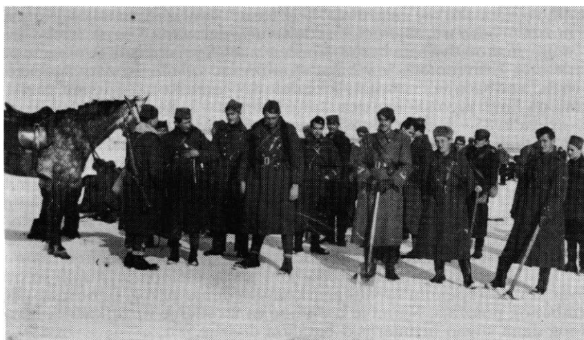
Treći bataljon 20. 01. 1945, na položaju između s. Kuzmina i r. Save, spreman za utvrđivanje

pad se imao izvesti isto veče sa oba bataljona prvog ešelona između r. Bosut i s. Komletinaca, pravcem Staro Selo - k. 84 - Duge Livade, odakle je trebalo izvući zaplenjenu artiljeriju. Posle artiljerijske pripreme 3. i 4. bataljon su prešli u napad u 21 čas, uz neposrednu podršku 15 minobacača i 5 topova, dok je 2. bataljon 3. brigade vršio demonstrativni napad na neprijatelja u s. Komletinci. I pored snažnog otpora neprijatelja prodor je uspeo. Za jedan sat oštre borbe razbijen je prednji kraj neprijateljske odbrane i osvojeni rovovi na liniji k. 83 - k. 84. Potom se levokrila četa 4. bataljona frontom povila prema Komletincima da štiti bok, a treći bataljon sa dve čete 4. bataljona nastavio je prodor. Oni su frontom širine 800 do 1.000 metara prodrli u neprijateljski rasproed od linije k. 81 (istočno Skela) - k. 85 (severozapadno Duge Livade), zauzevši rejon gde je trebalo da bude zaplenjena artiljerija. Pošto je pretragom rejona utvrđeno da je artiljerija odvučena, nađeni su samo prazni vatreni položaji gde su bila oruđa, bataljoni su se po naređenju štaba divizije povukli na prvobitne položaje sa 19 poginulih i 49 ranjenih boraca. 473