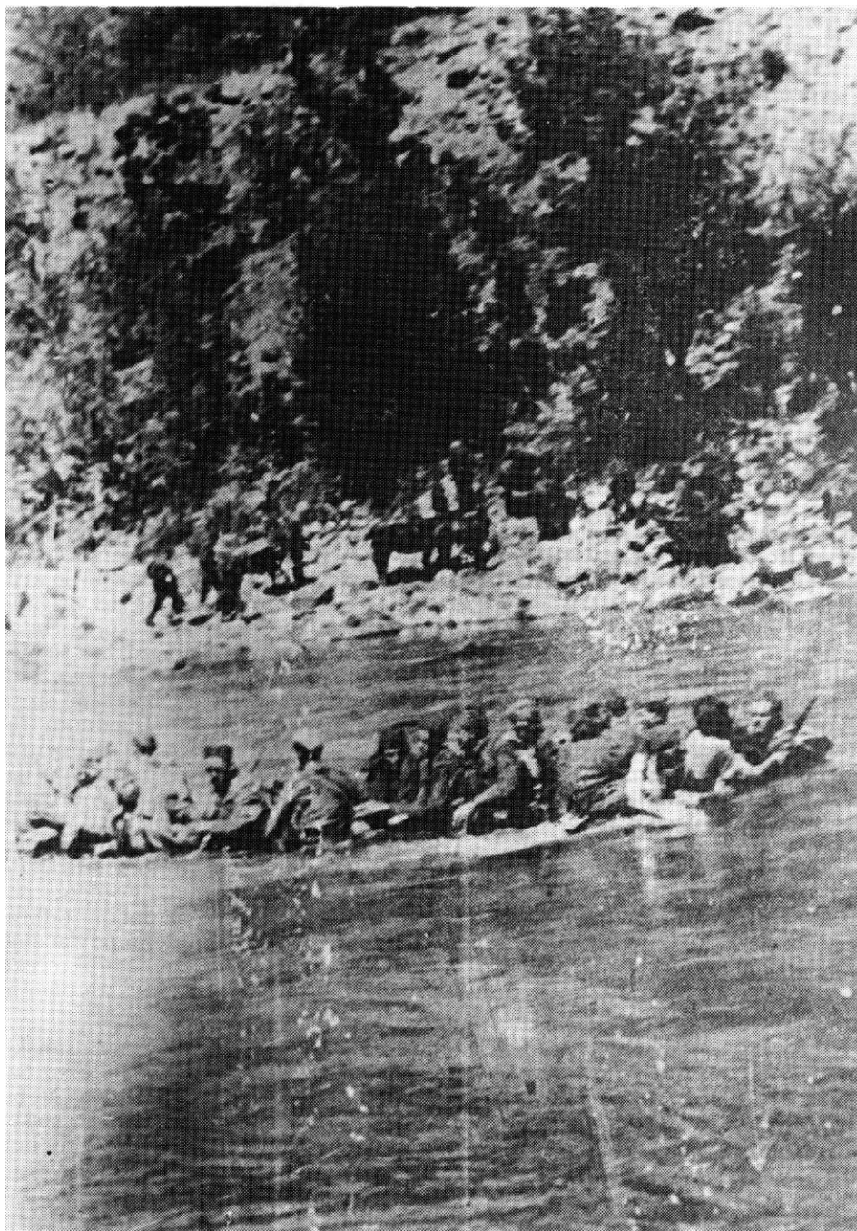
Grupa hrabrih »Matičevaca«, bori se sa brzom i hladnom Tarom da bi zauzela i obezbedila mostobran za prelaz brigade i cele divizije, 25. avgust 1944. godine.