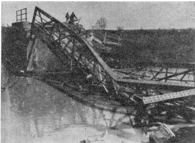
Kordunaški diverzanti na delu. Strusen most na reci Kupi kod s. Rečice.

Noću 2/3. septembra produženo je sa rušenjem komunikacije kod Generalskog Stola. Pruga je prekinuta na 80 mesta, put je miniran na 3 mesta i srušen je jedan podvožnjak raspona 22 metra. U isto vreme postavljena