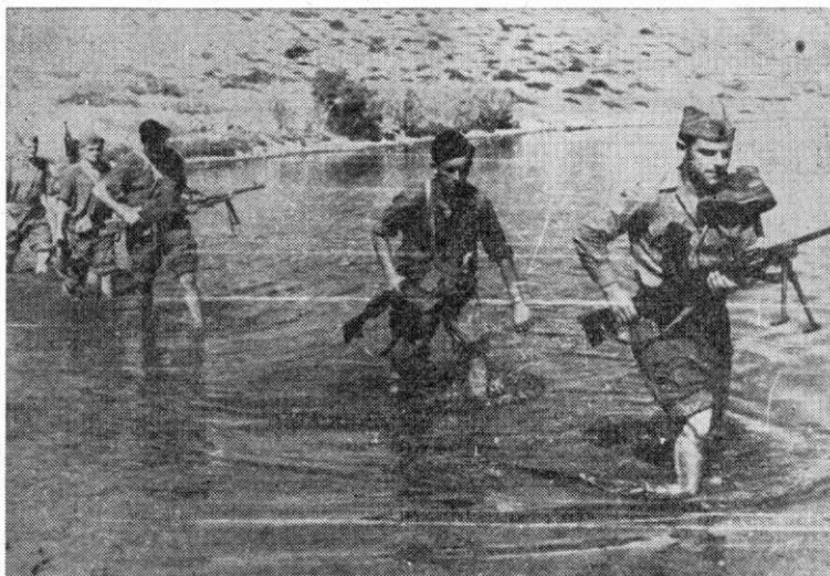
Prelaz jedinica 8. kordunaške divizije preko reke Mrežnice. Snimljeno polovinom jula 1944.

komitraljez, 2 puške, 1 pištolj, preko 1.000 puščanih metaka i nešto odeće i obuće. Mi smo imali 1 mrtvog i 3 ranjena, među kojima komandanta 4. bataljona Cvija Sudara.