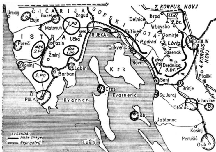
Raspored jedinica 43. istarske divizije sredinom marta, 1945.

U pozadini svog novog fronta preko Like, neprijatelj je uspostavio uporišta: Prijeboj, Plitvički Ljeskovac, Korenica, Debelo Brdo i Bunić.