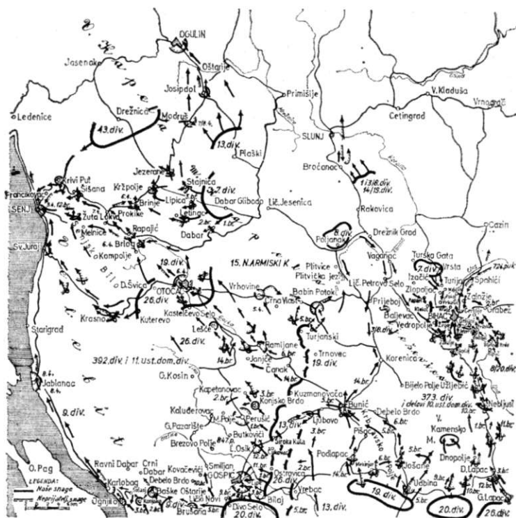
Ličko-primorska operacija (20. mart — 15. april 1945)

nine od zaostalih grupa fašističkih jedinica i da obezbjedi neometan rad pozadinskim ustanovama 4. armije i organizira vlasti—NOO-a na području Like. Ona je u toku aprila i maja u borbi ubila 66, a zarobila 270 neprijateljevih vojnika, uz izvjesne gubitke u poginulim i ranjenim. Jedna veća šarolika grupa ostataka razbijenih jedinica (250 ustaša i domobrana), kad je uvidjela da nema drugog izlaza, predala se bez otpora u Crnom Dabru. Zahvaljujući brzom i energičnom djelovanju jedinica 1. Učke posadne brigade i jedinica KNOJ-a, narod oslobođene Like bio je dobro zaštićen. Poslije sko-