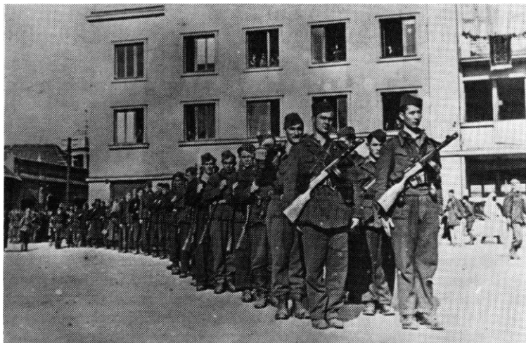
Postrojena jedinica 16. muslimanske brigade priprema se da krene na smotru. Tuzla 21. septembra 1944. godine

U narednoj depeši koja je tog dana poslata Vrhovnom štabu stoji: