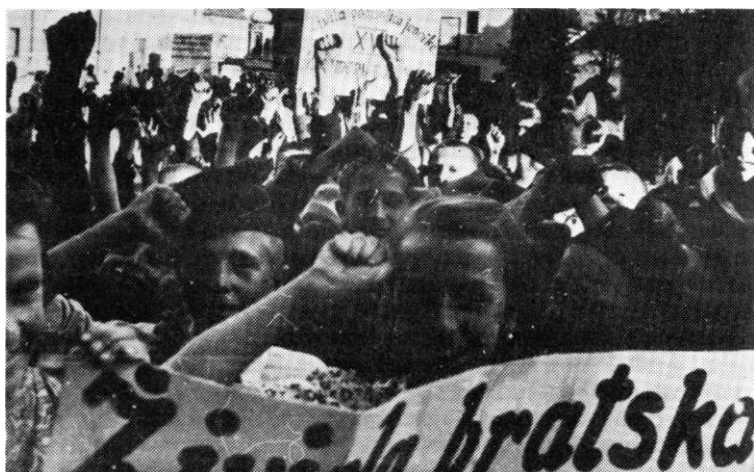
U Tuzli 21. septembra 1944. godine, na godišnjicu 16. muslimanske brigade

U izvještaju od 5. oktobra, izvijestio je Vrhovni štab da je do toga vremena »... na stranu naše vojske prešlo... preko 700 vojnika sa svom ratnom opremom« iz 13. SS divizije. 1021 Osim toga, u tom dokumentu on je konstantovao i sljedeće. »Pred vojničkim operacijama naših jedinica jedan procenat zelenog kadra i legije prilazi našim redovima, drugi predaje oružje, dok se još uvijek drže po strani pojedine grupe vojnički neorganizovane pod uticajem muslimanske reakcije...« 103 Do kraja novembra 1944. godine, dakle za nešto više od dva mjeseca, na tuzlanskom vojnom području mobilisano je oko 3.000 boraca za jedinice 3. korpusa. 104