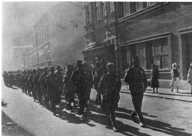
Jedinice 21. divizije na smotri 11. oktobra 1944. godine u Tuzli

povezana sa tim krupnim događajem. Na vijest daje oslobođen glavni grad Jugoslavije, Tuzla je odmah počela da se kiti zastavama i transparentima, a sutradan, od ranog jutra, njene ulice su se punile povorkama građana, vojske, školske djece i organizacija omladine i žena. Masa razdraganih manifestanata iskupila se pred štabom 3. korpusa i Oblasnim narodnooslobodilačkim odborom. Razne delegacije iz grada i sa sela u dolini Spreče stigle su da izraze svoju radost i čestitke. Istog dana su u crkvama (pravoslavnoj i katoličkoj) i džamiji održana svečana bogoslužjenja u čast oslobođenja glavnog grada Jugoslavije. Njima su prisustvovala delegacije vojske i narodnih vlasti. U toj situaciji je riješeno da se godišnjica 19. birčanske brigade održi sutradan, to jest dva dana ranije - 22. oktobra. Njen osnovni sadržaj bio je u održavanju zborova u selima oko Tuzle, gdje su bile raspoređene njene jedinice. Na niima je najvažnije bilo da se prisutni upoznaju sa značajem oslobođenja glavnog grada Demokratske Federativne Jugoslavije. Tek uveče je priredba u Živicama bila posvećena godini borbe i života 19. birčanske brigade." 61