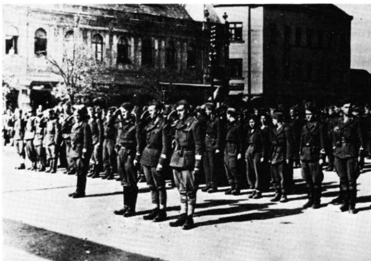
Dio stroja 16. muslimanske brigade na dan njene prve godišnjice. Tuzla, 21. septembra 1944. godine

grada i najbliže okoline. Da bi za tu priliku obezbijedio grad i osigurao da se proslava održi bez uznemiravanja, štab 3. korpusa je naredio, 20. septembra, da se 21. brigada 38. divizije odmah uputu u rejon sela Breške, 10 km sjeverno od Tuzle. S tim ciljem je naredeno i 20. romanijskoj brigadi da na dan proslave napadne grupaciju od oko 1.000 četnika iz sastava Majevičkog korpusa koja se prikupila u rejonu Požarnice. Razbijanje tih četnika bilo je potrebno i zbog toga da se pouzdanije osigura drum Tuzla - Zvornik. 71)