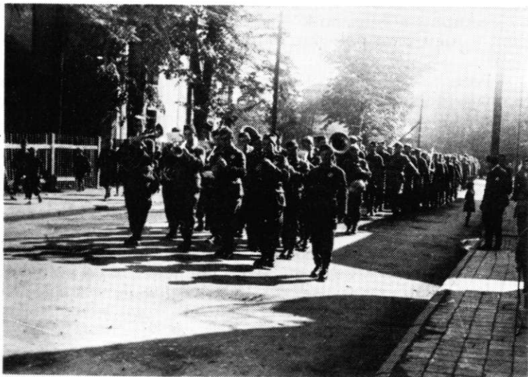
Jedinice 27. divizije na smotri 11. oktobra 1944. godine u Tuzli

divizije i zelenom kadru. Borci koji su dezertirali iz 13 SS divizije bili su dobro vojnički obučeni u njemačkim nastavnim centrima i imali su dosta borbenog iskustva, stečenog u borbama protiv jedinica 3. i 12. korpusa. Ali, ispoljavali su nesnalaženje u noćnim borbama i primjetno su zazirali od njih. Zato je u brigadama odmah organizovano obučavanje tih boraca za noćne borbe. Međutim kako se i očekivalo, osnovni problem kod njih su bila razna shvatanja i navike s kojim su došli iz neprijateljske vojske. Kod pojedinaca se zapažalo da se u novoj sredini osjećaju nelagodno, da su rezervisani i da s izvjesnom zebnjom gledaju na svoj položaj. Radom partijske i skojevske organizacije te pojave su brzo preovladane. Posebno se vodilo računa o tome da i ti borci koji su došli iz neprijateljevih vojski budu u svemu ravnopravni sa starijim borcima koje su zatekli u četama. Političkim radom i brižljivim odnosom težilo se da se i kod njih što prije stvori osjećaj pripadnosti NOP-u i Narodnooslobodilačkoj vojsci i razvije politička ubijedenost u vrijed-