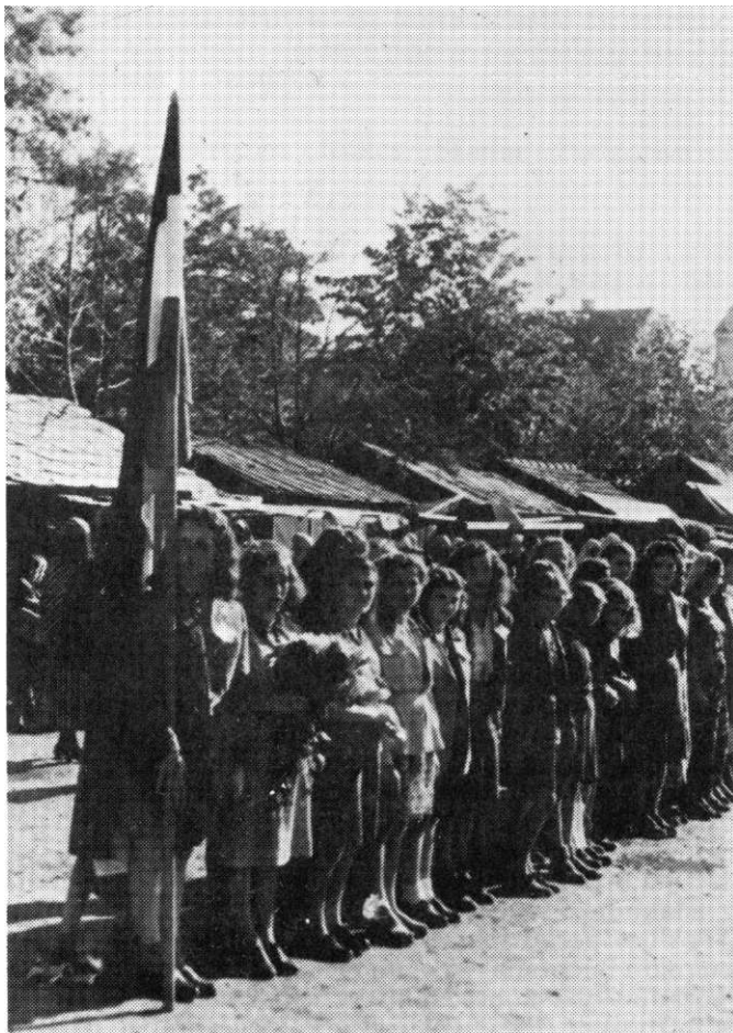
Omladina Tuzle sa zastavom koju je darovala 27. diviziji na njenu prvu godišnjicu, U. oktobra 1944. godine