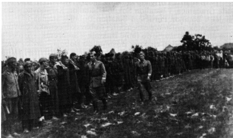
Komandant 27. divizije Miloš Zekić u pratnji načelnika štaba Jakoba Vodušeka, vrši smotru jedinica postrojenih u okolini Gradačca, kraj maja 1945. godine

limanska brigada imala 134 mrtva i 400 do 500 ranjenih, a 19. birčanska brigada 72 poginula, 71 nestalog i 159 ranjenih. Podaci o gubicima jedinica 20. romanijske brigade nisu nađeni u raspoloživim izvorima, ali ona nije značajnije učestvovala u borbama, pa su njeni gubici u odnosu na druge dvije brigade neuporedivo manji. Ukupno je, dakle, u tim posljednjim borbama, na svom posljednjem zadatku tokom narodnooslobodilačkog rata, 27. divizija imala blizu 300 mrtvih i nestalih i više od 600 ranjenih boraca i starješina. 95