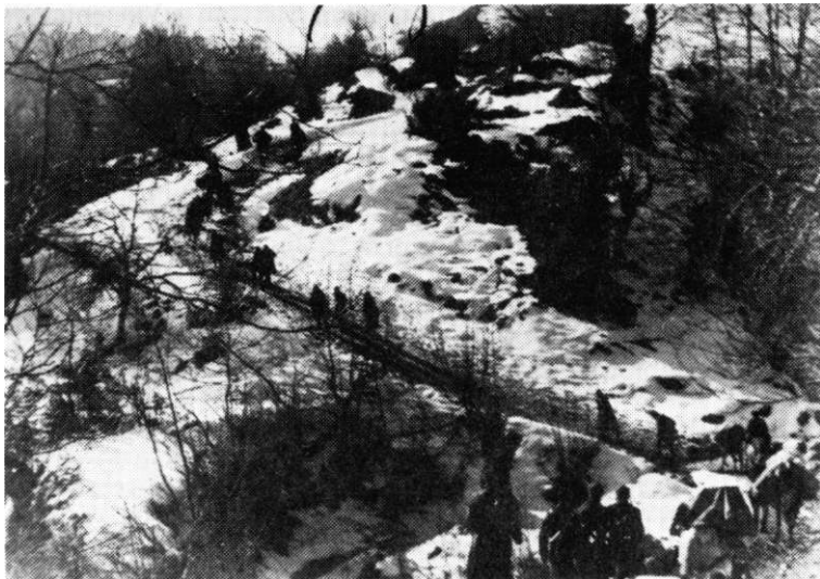
Pokret jedinica 27. divizije od Kamenice ka Capardima, februar 1945. godine

Kako neprijatelj nije krenuo prema Kladnju i Šekovićima, 27. divizija je krajem januara i početkom februara imala kratak predah, za vrijeme kog su izvršena četiri noćna napada na pojedine neprijateljeve položaje oko Vlasenice (27. i 28. januara i 1. i 4. februara), s ciljem da se na taj način vežu njemačke snage. U svakom od njih učestvovala je 19. birčanska brigada sa jednim do dva bataljona, a u napadu 1/2. februara bila su angažovana i dva bataljona 20. romanijske brigade. Ali, to vrijeme pritiska na neprijatelja u Vlasenici najviše je korišćeno za prijem novih boraca, za sređivanje jedinica i za intenzivnu vojnu obuku. Još 18. januara 27. divizije je dodijeljeno 1.097 pari cipela i manja količina odjeće i rublja. Time je borački sastav dobrim dijelom bio obezbijeden obućom, zbog čijeg je nedostatka u tadašnjim zimskim uslovima, borbena aktivnost i efikasnost jedinica bila umanjena. 96