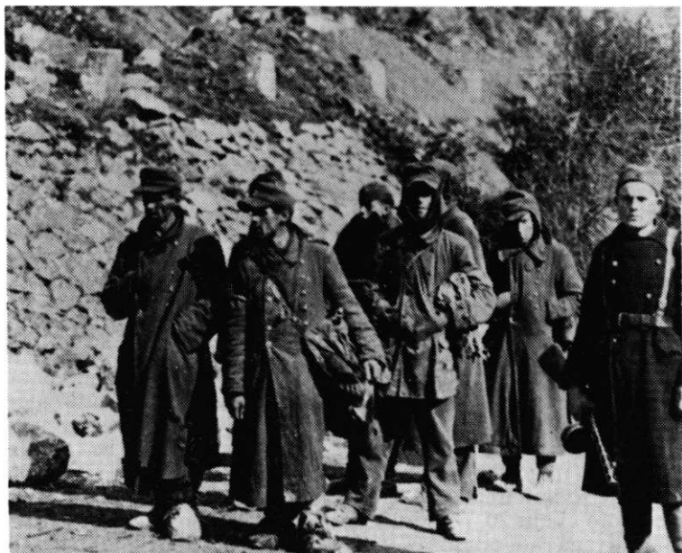
Zarobljeni njemački vojnici u borbama kod Zvornika, 23. februar 1945. godine

su na kraju fizičkih mogućnosti i više nisu imali snage ni za juritiše niti za povlačenje ispred neprijatelja. 138) »