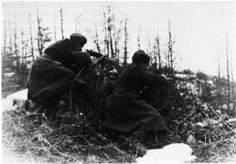
Dva borca 20. romanijske brigade na položaju kod Kamenice, februara 1945. godine

Kasabe, Drinjače, Diviča i Zvornika, a i neprijateljeve snage i sredstva uz lijevu obalu Drine." 110 Trebalo im je još vrlo malo do Drine, negdje nepun kilometar, pa da njemačka grupacija bude razdvojena na dvije grupe. I za naše divizije i za neprijatelja je bilo presudno da prema toj uskoj traci zemljišta uz lijevu obalu Drine, gdje se rješavao ishod borbe, privuku svoje rezerve. Međutim, štab 27. divizije nije je imao. Sve svoje snage, izuzev 19. birčanske brigade, uveo je u borbu. Zašto i tu brigadu, koja je ostavljena prema Vlasenici, nije privukao na front između Drinjače i Zvornika kada je ona, uveče 8. februara, zaposjela Vlasenicu, nema odgovora u izvorima. U ostalom, ona tih dana i nije bila u njegovoj operativnoj ingerenciji, jer je samostalno dejstvovala na pravcu koji je bio korpusnog i armijskog značaja. Ali, 17. divizija je imala u rezervi cijelu 15. majevičku brigadu. Njena dva bataljona su bila u rejonu sela Stanišića u gotovosti za upotrebu na pravcu napada 2. krajiške brigade (pravcem: Dobra Voda - Šabići - Sejfići), a jedan je u selu