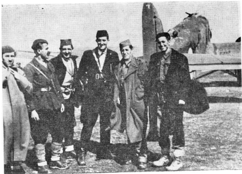
Руководство партизанског аеродрома код Иванграда, јануар 1944.