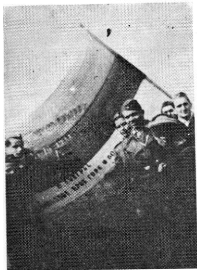
Представници УСАО Црне Горе предају заставу 4. бри- гади, јануар 1944.