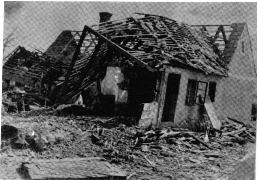
Kuća opančara Tome Vuksana