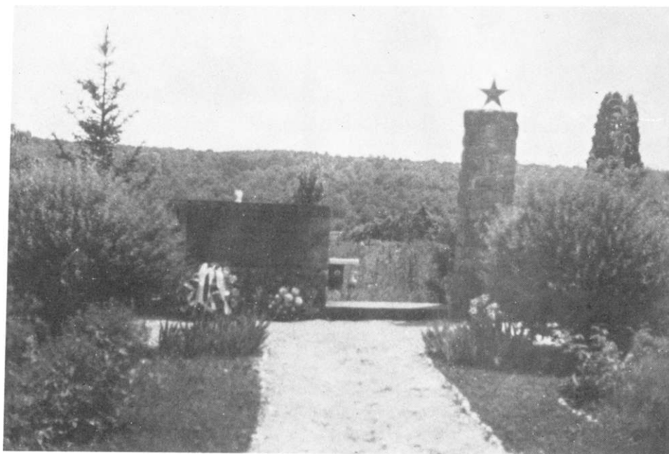
Spomenik palim borcima