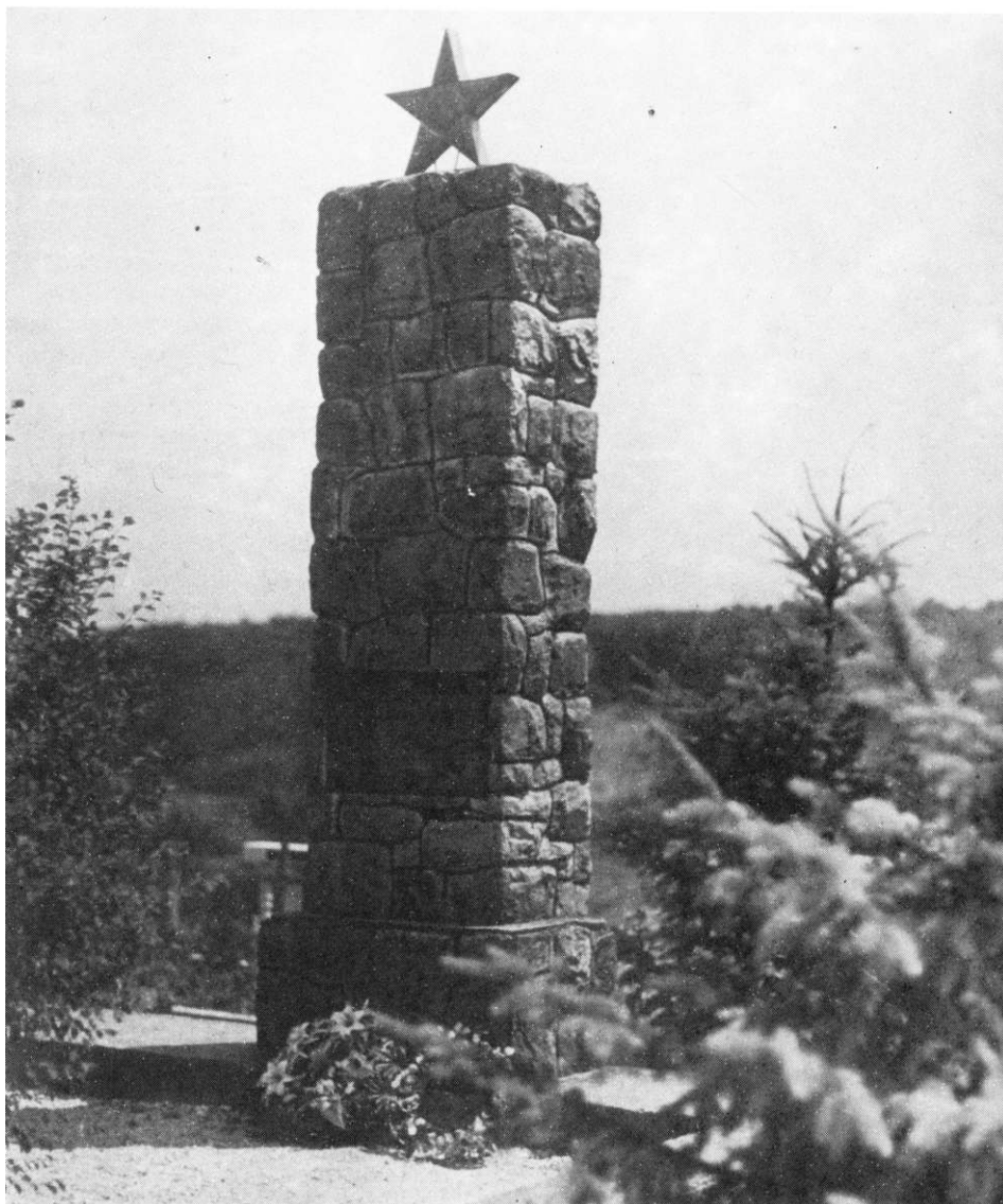
Spomenik palim borcima

TEKST NA SPOMENIKU: «U spomen poginulim borcima NOR-a podižu preživjeli borci SUBNOR-a mjesna udruženja Lasinje i Desno Sredičko.