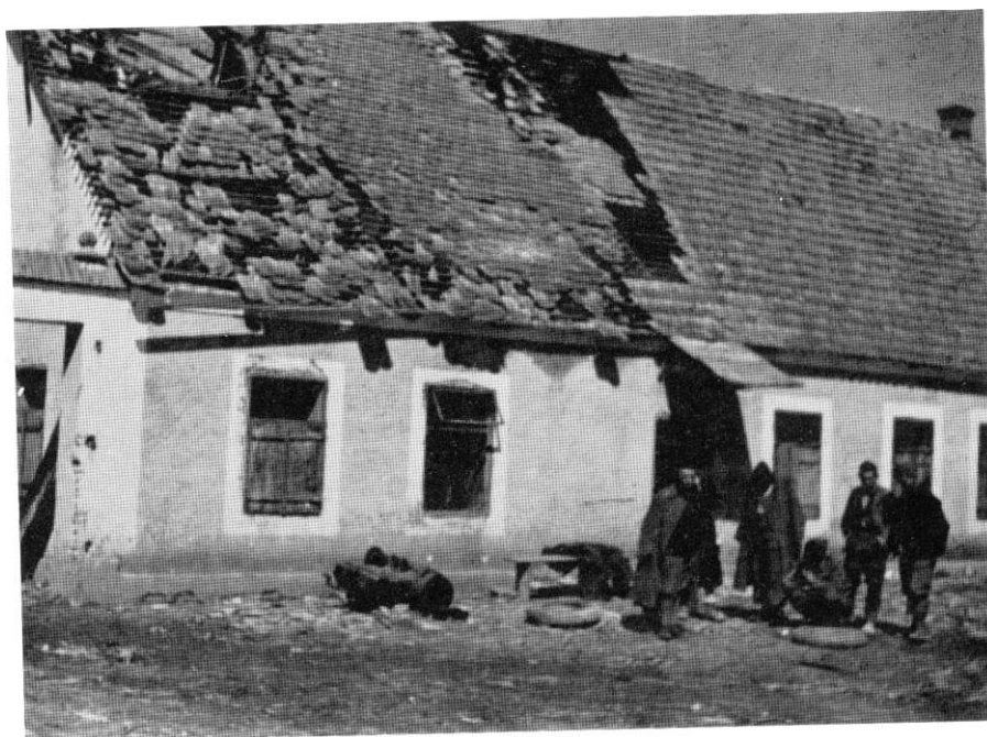
Kuća braće Milića