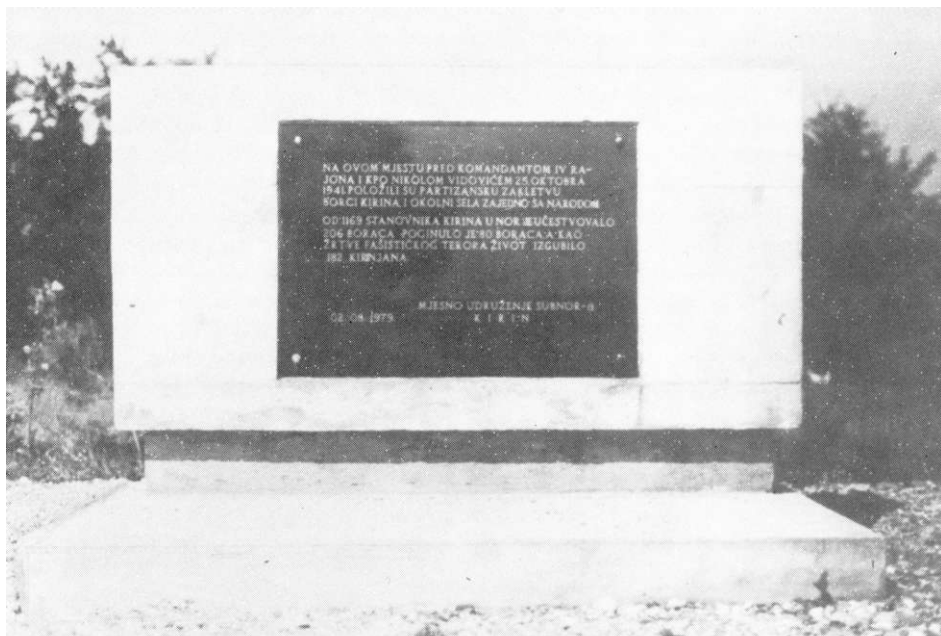
Spomenik zakletve, palim borcima i ŽFT

TEKST NA SPOMENIKU: »Na ovome mjestu pred komandantom IV rajona I KPO Nikolom Vidovićem 25. oktobra 1941. položili su partizansku zakletvu: borci Kirina i okolnih sela zajedno sa narodom. Od 1169 stanovnika Kirina u NOR-u je učestvovalo 206 boraca. Poginulo je 80 boraca, a kao žrtve fašističkog terora život izgubilo 182 Kirinjana.«