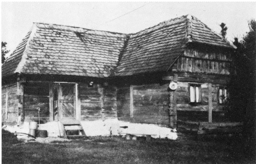
Kuća u Čemernici gdje su ustaše vršile silovanje, a zatim odvodile i ubijale u Ratkovića Strani.