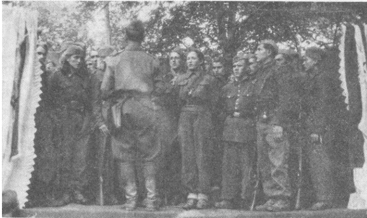
Pjevački hór 1. bataljona — priredba u Velikim Bastajima avgusta 1944. godine

su borbu sa neprijateljem i kod s. Batinjani, ali bez vidnijih rezultata.