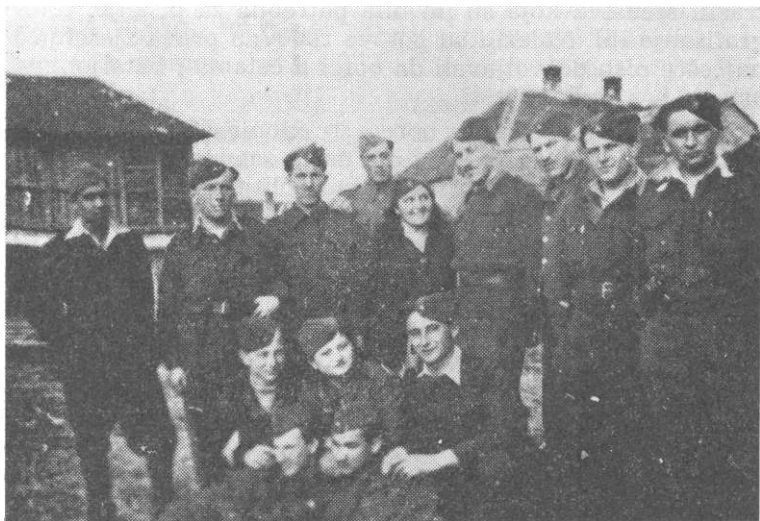
Muzika 17. udarne brigade

Od polovine jula do polovine avgusta u brigadi je održano 5 usmenih novina, a u selima — 13 mitinga. Dva mitinga je priredila omladina, a borci su bili samo gosti. Izdana su i dva broja brigadnih zidnih novina. Uvježbani četni horovi postojali su u 1. i 2. četi 2. bataljona. Diletantske grupe izvodile su razne skečeve i kratke šaljive komade. koji su bili veoma omiljeni i među borcima i u narodu, jer su često ismijavali neprijatelja, ali bilo je i onih sa žaokom na račun partizana. I neki borci su pisali kratke skečeve. Tako je jedan borac iz 3. bataljona napisao dosta dobar skeč u vezi sa izdajničkim radom Hrvatske seljačke stranke i dao mu naslov »Prodavači sjemenja«. Takve diletantske grupe postojale su tada u 1, 2. i 3. bataljonu dok je 4. bataljon u tome zaostajao.