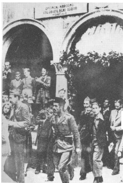
Ivan Mordin Crni, sekretar Okružnog komiteta KPH za južnu Dalmaciju, uložio je mnogo žara i napora u formiranje Trinaeste brigade. Crni je poginuo u februaru 1944. Narodni heroj