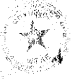
Faksimil Naredbe Vrhovnog štaba o formiranju VIII. dalmatinskog korpusa NOV Jugoslavije

3. U sastav korpusa raspoređuju se: - 1. brigada - 2. brigada - 3. brigada - 4. brigada - 5. brigada - 6. brigada - 7. brigada - 8. brigada - 9. brigada - 10. brigada - 11. brigada - 12. brigada - 13. brigada - 14. brigada - 15. brigada - 16. brigada - 17. brigada - 18. brigada - 19. brigada - 20. brigada - 21. brigada - 22. brigada - 23. brigada - 24. brigada - 25. brigada - 26. brigada - 27. brigada - 28. brigada - 29. brigada - 30. brigada - 31. brigada - 32. brigada - 33. brigada - 34. brigada - 35. brigada - 36. brigada - 37. brigada - 38. brigada - 39. brigada - 40. brigada - 41. brigada - 42. brigada - 43. brigada - 44. brigada - 45. brigada - 46. brigada - 47. brigada - 48. brigada - 49. brigada - 50. brigada - 51. brigada - 52. brigada - 53. brigada - 54. brigada - 55. brigada - 56. brigada - 57. brigada - 58. brigada - 59. brigada - 60. brigada - 61. brigada - 62. brigada - 63. brigada - 64. brigada - 65. brigada - 66. brigada - 67. brigada - 68. brigada - 69. brigada - 70. brigada - 71. brigada - 72. brigada - 73. brigada - 74. brigada - 75. brigada - 76. brigada - 77. brigada - 78. brigada - 79. brigada - 80. brigada - 81. brigada - 82. brigada - 83. brigada - 84. brigada - 85. brigada - 86. brigada - 87. brigada - 88. brigada - 89. brigada - 90. brigada - 91. brigada - 92. brigada - 93. brigada - 94. brigada - 95. brigada - 96. brigada - 97. brigada - 98. brigada - 99. brigada - 100. brigada