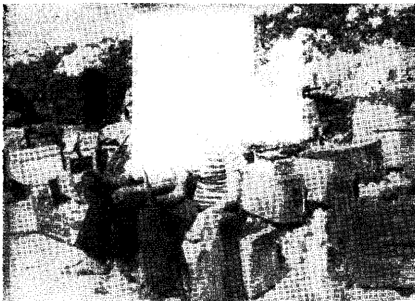
Na stazi iznad Podgore, septembar 1943.: talijansko oružje zaplijenjeno u kapitulaciji

Predali su oružje osim vojske i karabinjeri, lučka policija, Kvesturini, financi i mornari. Osim onog skupnog predavanja u kasarnama i logorima, ako je ma bilo tko zaustavio kakovog oboružanog Talijana, i pozvao ga da mu preda oružje, on bi to odmah uradio pa i kacigu. Vidalo se djece od 10 godina sa kacigom na glavi i bombama ručnim. Tako isto i svaki zaustavljeni auto, kamion, motocikla, bicikla predavali se tko bi prvi to zatražio .. «