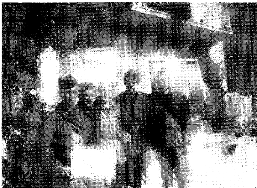
Štab XII. Bračko-hvarsko-viške brigade

već dotada postojeća Prva grupa udarnih bataljona pretvorena u VI., a Druga grupa u VII. dalmatinsku brigadu. Međutim, grupe udarnih bataljona u sjevernoj Dalmaciji bile su samo osnove za novoformirane brigade, u čije redove s kapitulacijom Italije pristize velik broj dobrovoljaca i mobiliziranog ljudstva.